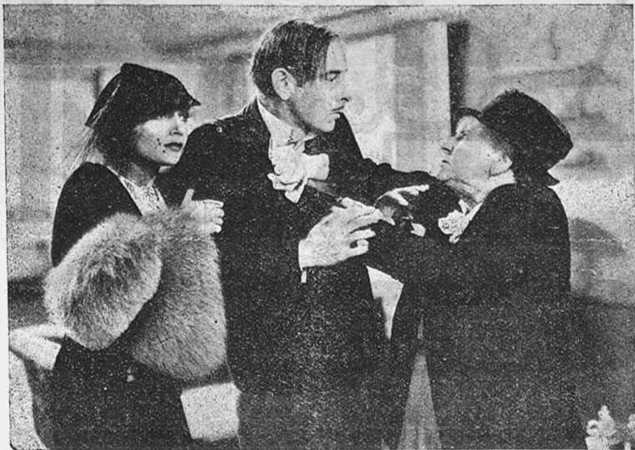
Una escena de la producción americana "Angel del arroyo" que distribuye Cifesa.

blema cuya contestación llevara a indicar racionalmente quién era el personaje que encarnaba el incitante misterio del cuarto 309.