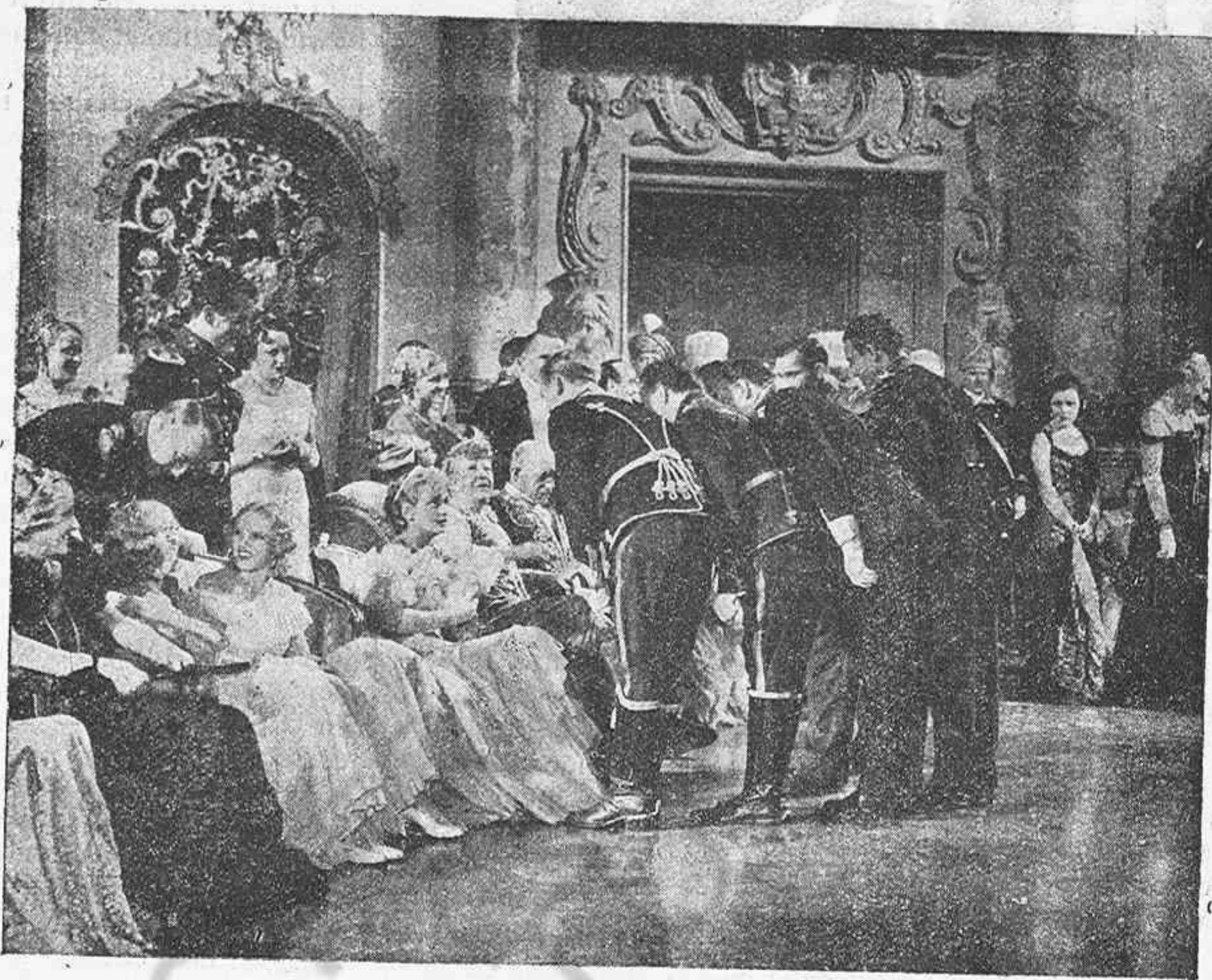
Una de las brillantísimas escenas de la opereta alemana "Fiesta en Palacio" que presenta Ciresa.

Combatir el cinema per sistema, és una mala posició