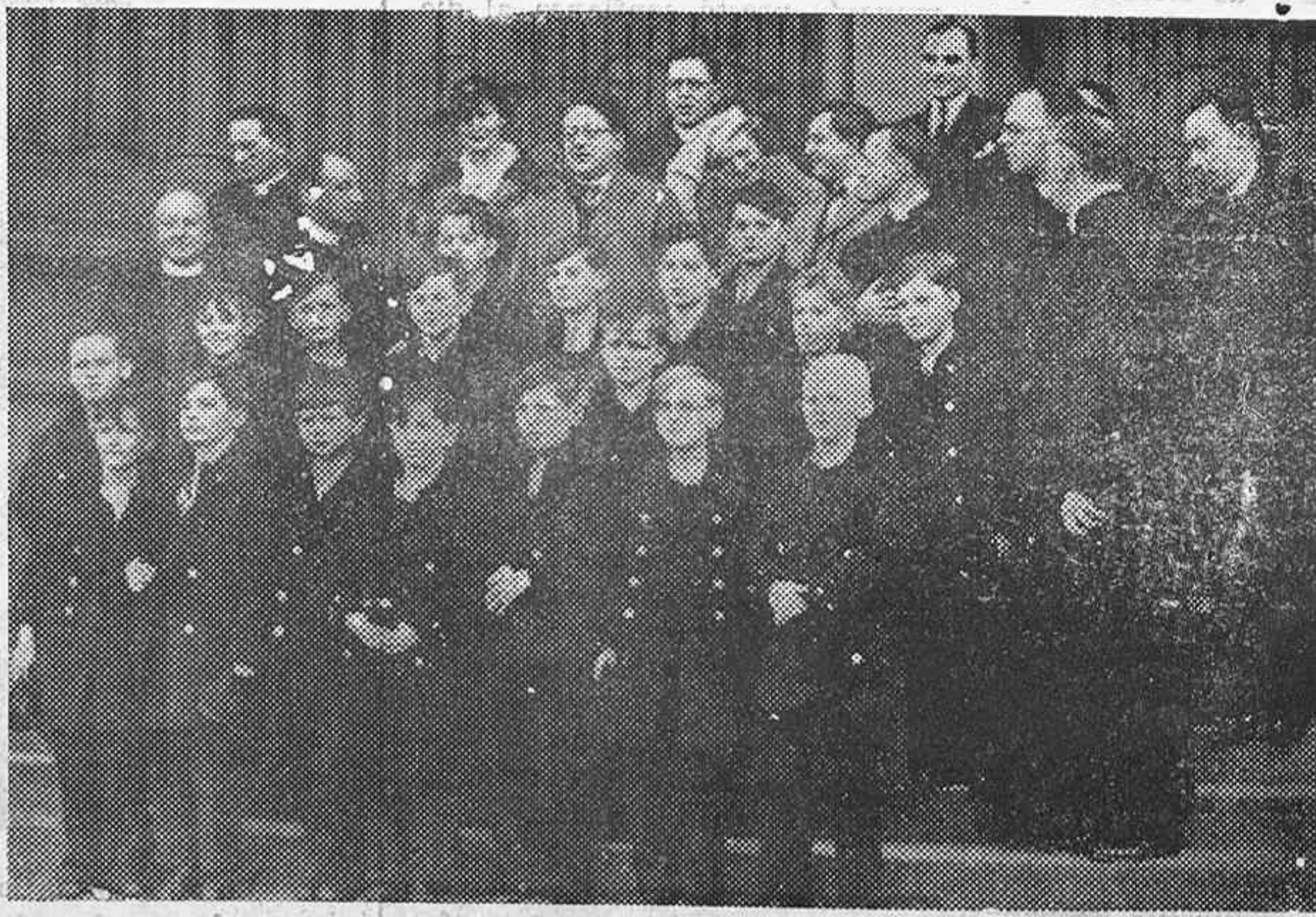
Universalmente es conocido el coro infantil de la catedral de San Esteban de Viena debido a que varias veces lo hemos oido en el cine y en la radio, el cual es conocido como el mejor coro infantil del mundo. Llegada del coro a Sidney donde tiene que dar algunos conciertos.