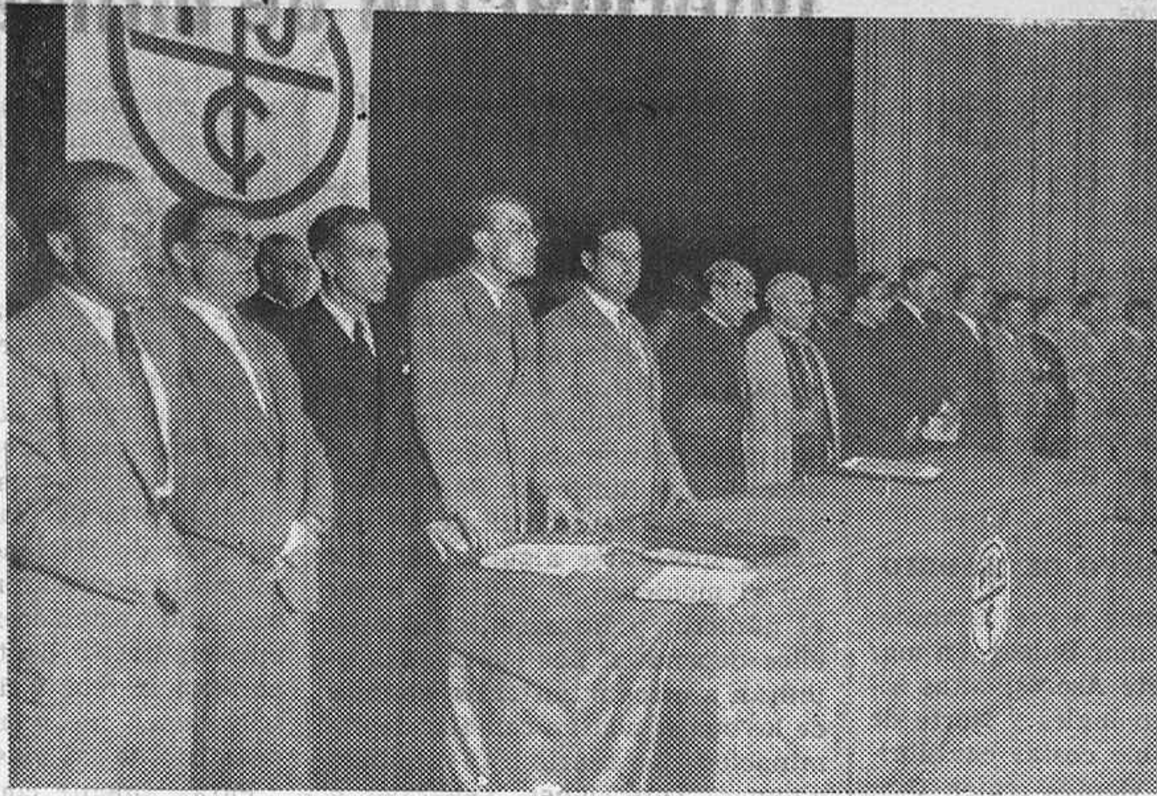
El domingo tuvo lugar en el Palacio de Proyecciones de Montjuich (Barcelona), la clausura de la Segunda Semana de Estudios con asistencia del Cardenal Vidal y Barraquel y el Obispo de Barcelona. La presidencia.