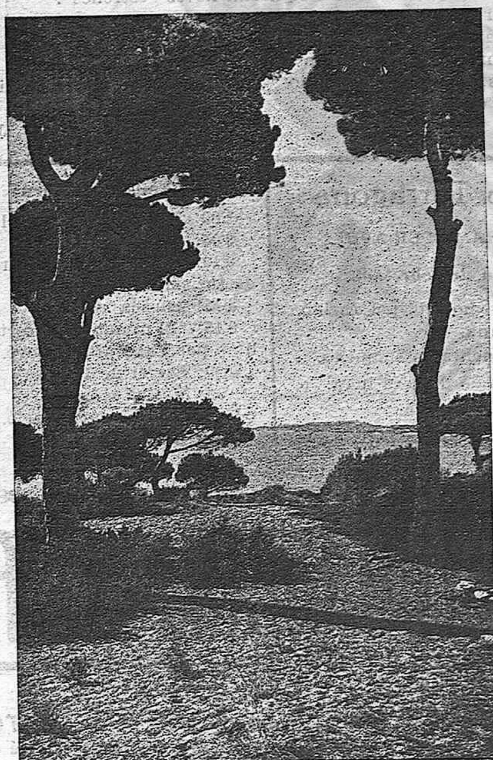
Bell indret de "La Pineda" on quedaran emplaçades les nostres Colònies Avantguardistes

Aquest és el nostre avantguardista ideal. I que no us en pintin d'altre. A les nostres COLONIES AVANTGUARDISTES viuran aquesta vida. De sana i santa alegria, d'amor a Déu i d'amor al pròxim, amb la vista ben oberta a tota la creació i amb el pit esbatonat a tots els grans ideals, aquesta vida és la que els ensenyem a viure.