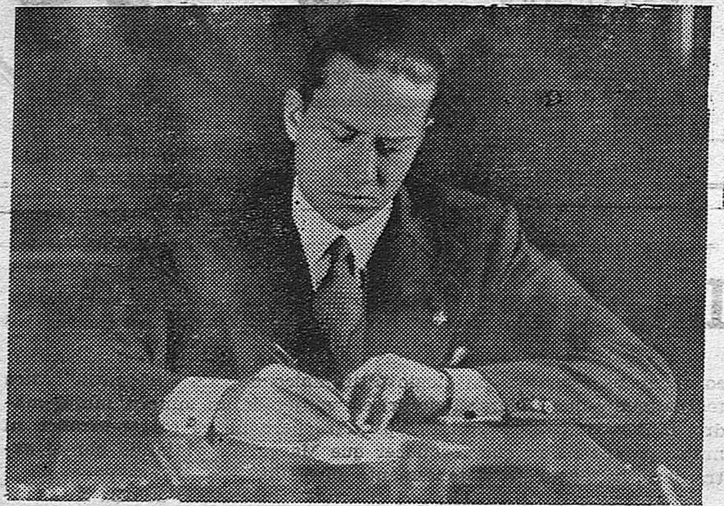
El Conde de Ciano, yerno del "Duce", ha sido nombrado ministro de Negocios extranjeros, anteriormente ocupaba el puesto de ministro de Propaganda. El último retrato del Conde De Ciano.