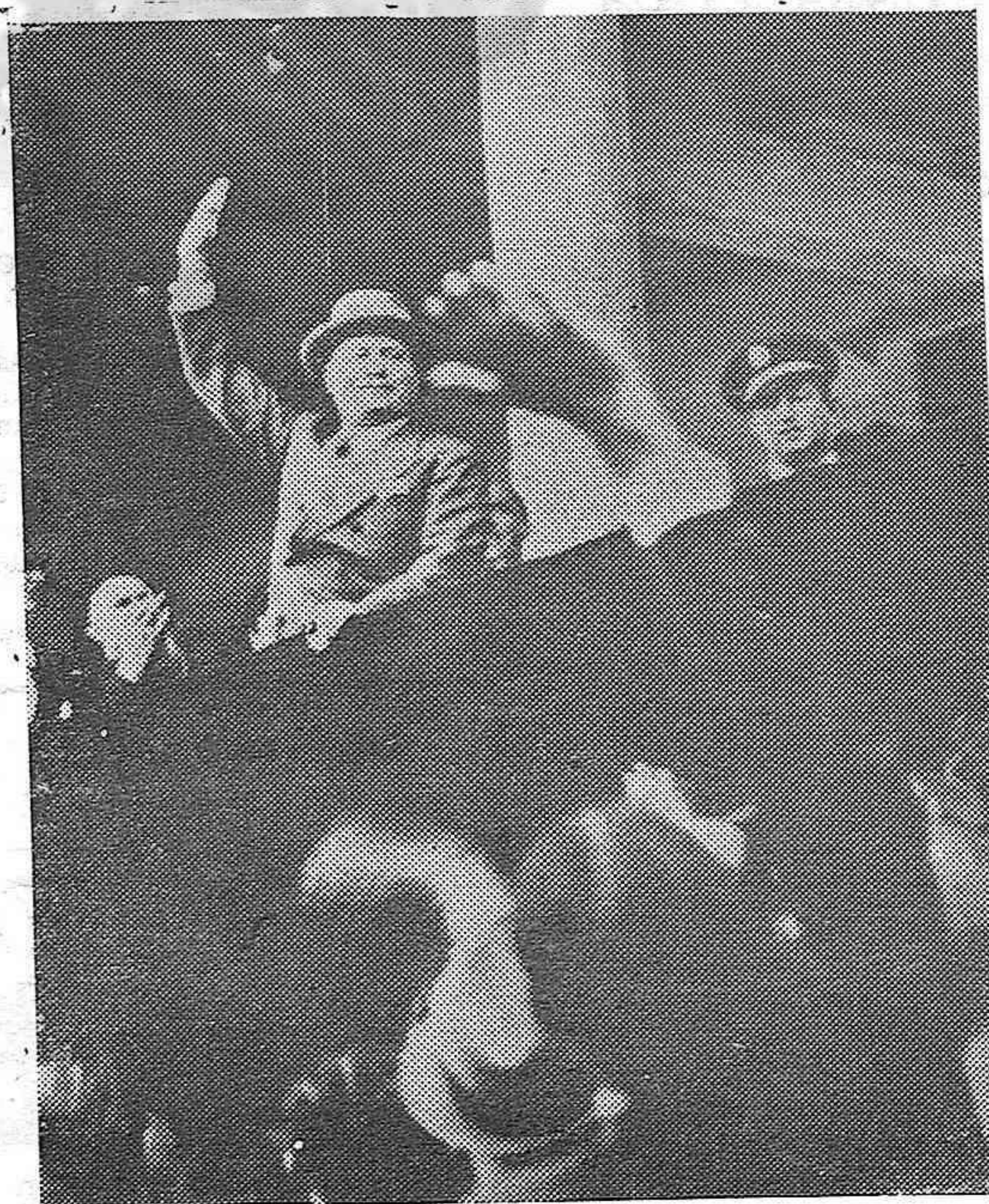
El antiguo vice-canciller austriaco ha asistido al partido de futbol que ha tenido lugar en Roma entre Italia y Austria, el cual terminó con un resultado de un empate de 2 a 2. -- Mussolini, contestando a las ovaciones de la muchedumbre. A su izquierda, el vice-canciller Starhemberg.