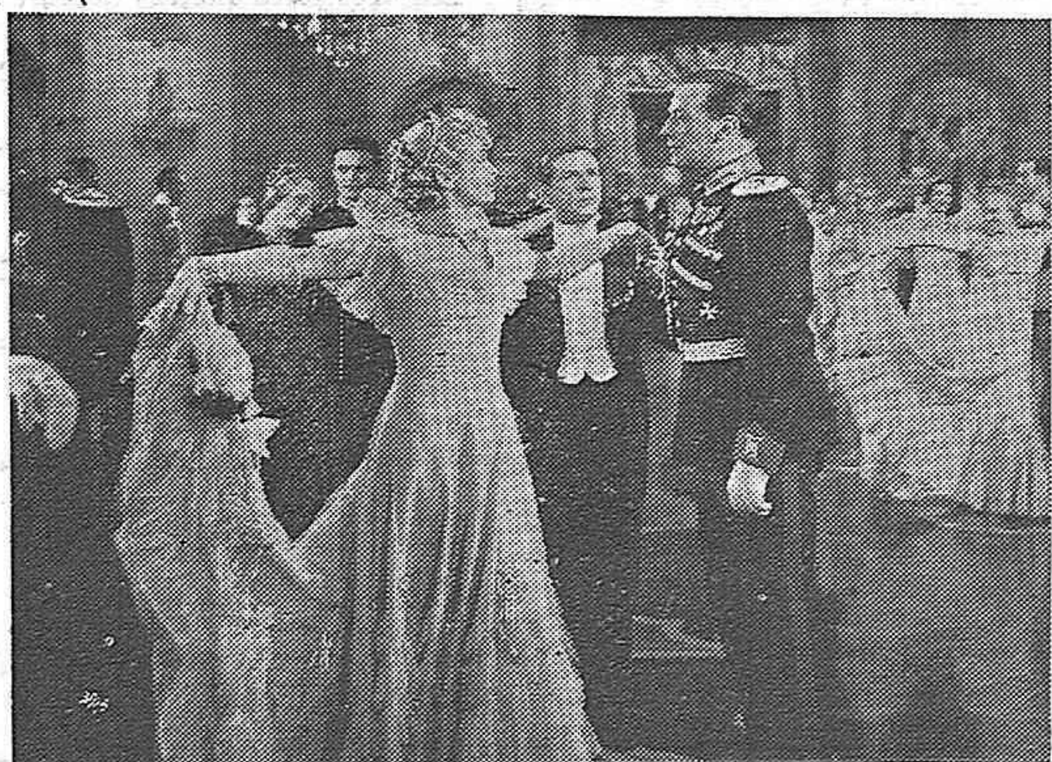
Un magnífico plano de la opereta "Fiesta en Palacio" que presenta "CIFESA".

Les condicions són: garantia mínima, dos milions de francs, 500.000 dels quals lliurats en signar el contracte; percentatge: 50 per 100.