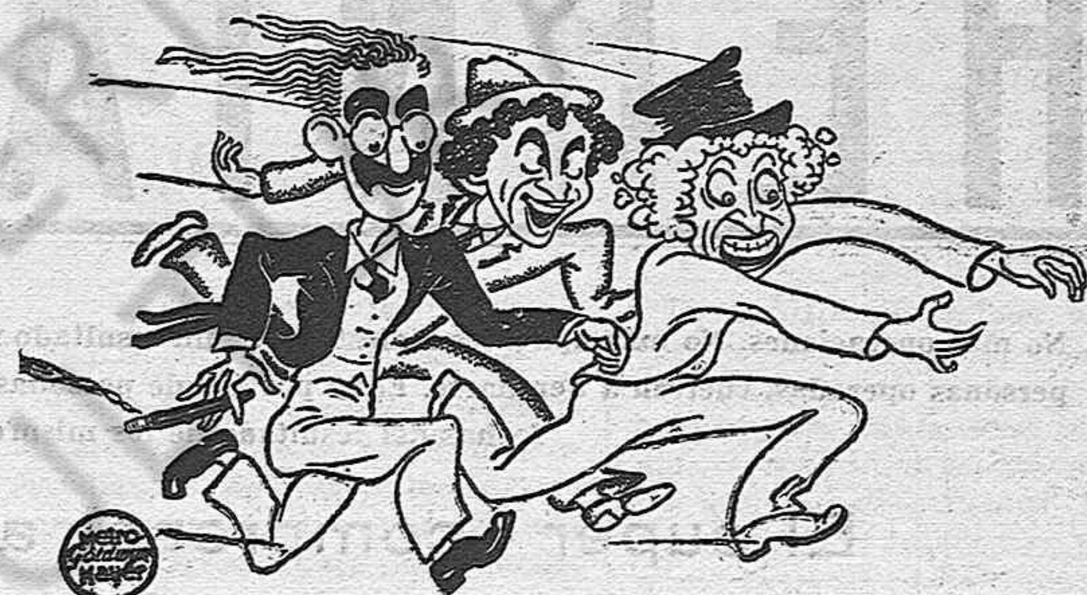
Groucho, Chico y Harpo, los tres ases de la risa, protagonistas de "Bajo el signo de Orfeo", de M. G. M.

Los directores, la script-girl (secretaria de guión), los operadores y sus ayudantes, los mecánicos y electricistas, los carpinteros, los tramoyistas, y los pocos curiosos que allí estábamos conteníamos las risas a duras penas para no estropear la banda sonora. Al terminar la escena, los nervios de todos es-