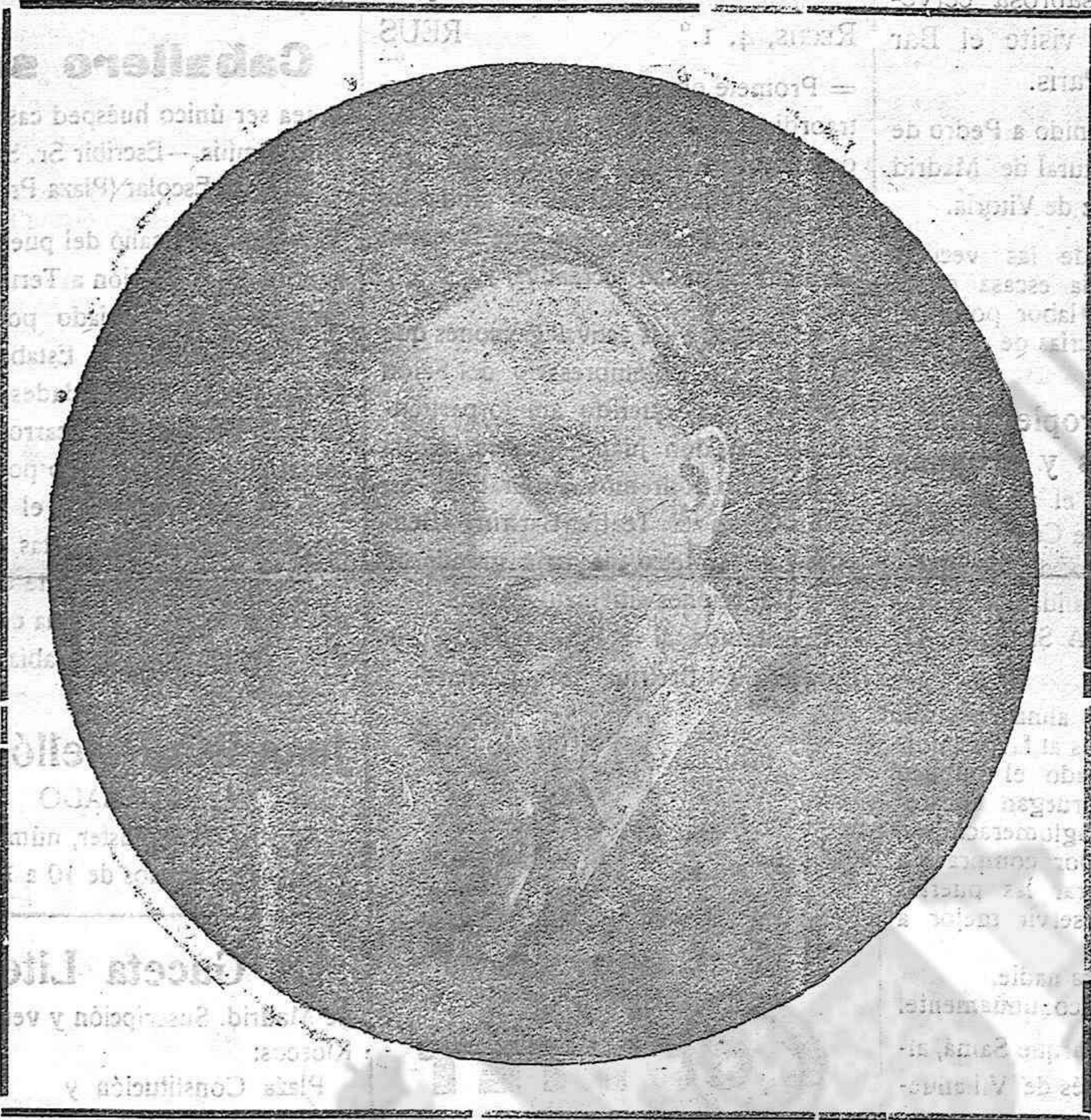
Retrat d'Ignasi Iglésies fet l'any 1910

Enc que modest, avui ens complavem en rendir aquest tribut d'homenatge al qui fou un gran poeta i dramaturg, cantor i traductor de la llar i de les costums de Catalunya, mor quan encara podia enlairar-nos amb ses obres i amb sos cants.