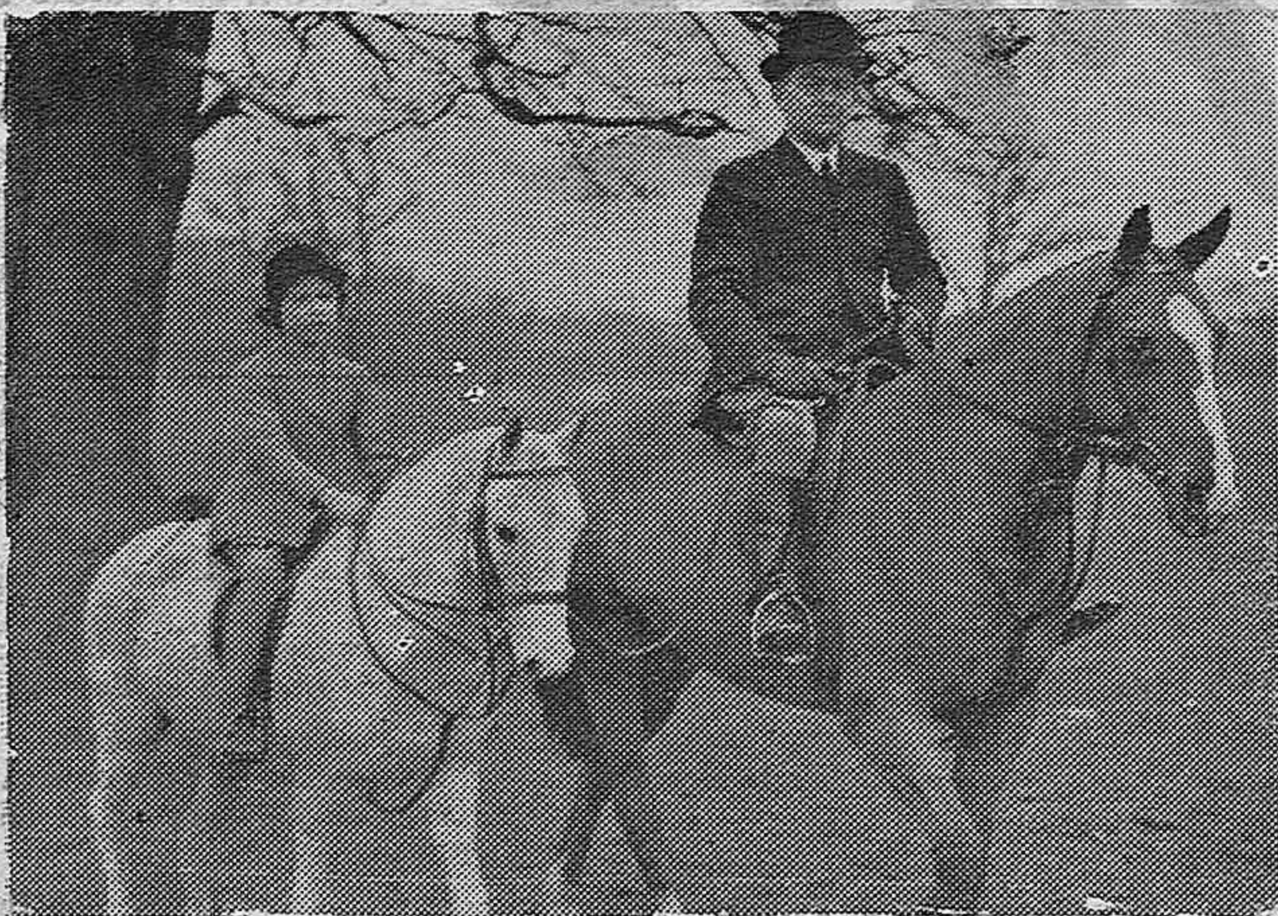
FOTOGRAFIA EXCLUSIVA DE LA PRINCESA ELISABETH (Londres)

Esta pequeña amazona, es hija mayor de los duques de York y futura reina de Inglaterra, en caso que Eduardo VIII no se case y no tenga sucesión, la cual diariamente toma clases de equitación. La pequeña princesa en el parque de Windsor con su profesor de equitación.