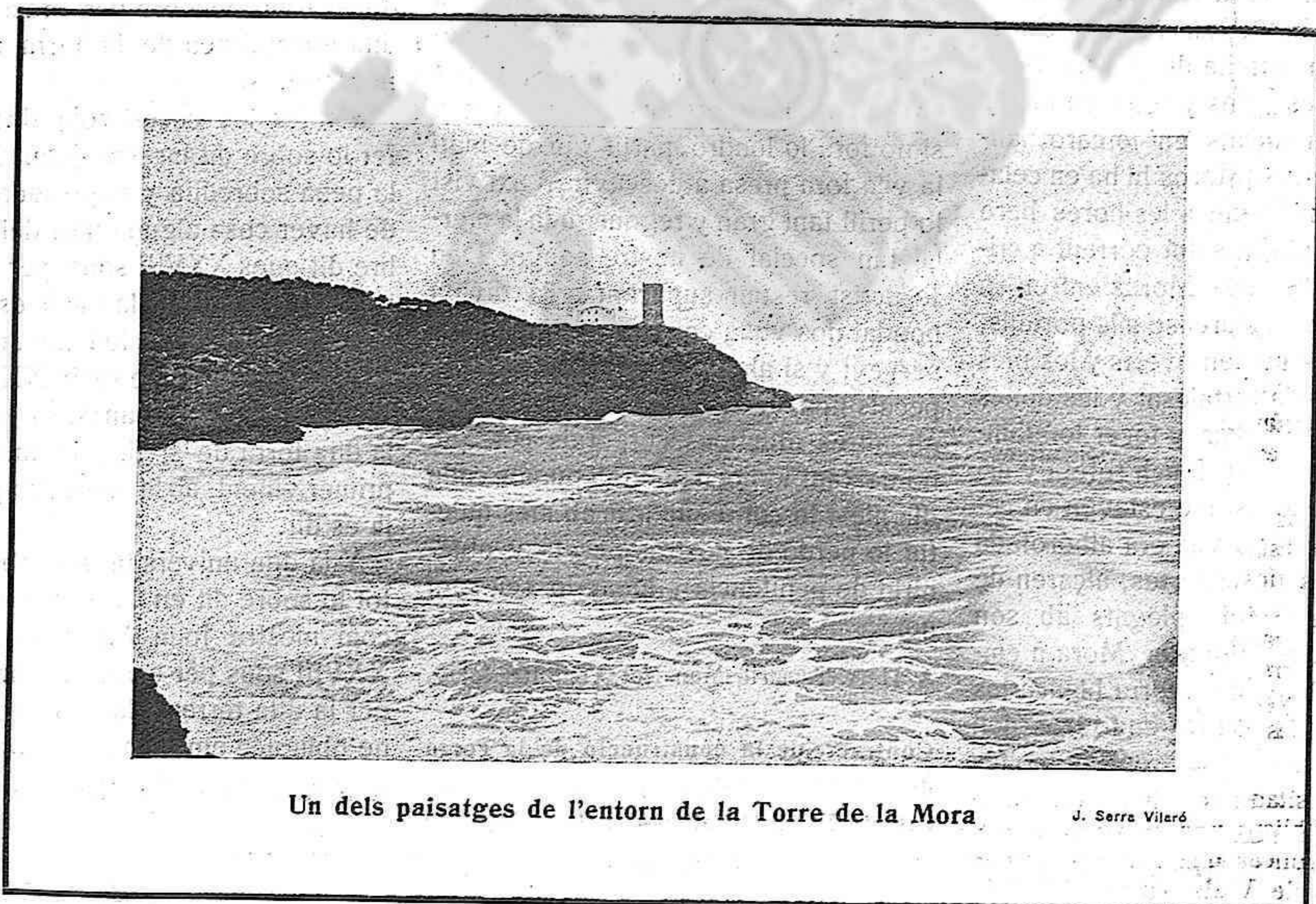
Un dels paisatges de l'entorn de la Torre de la Mora