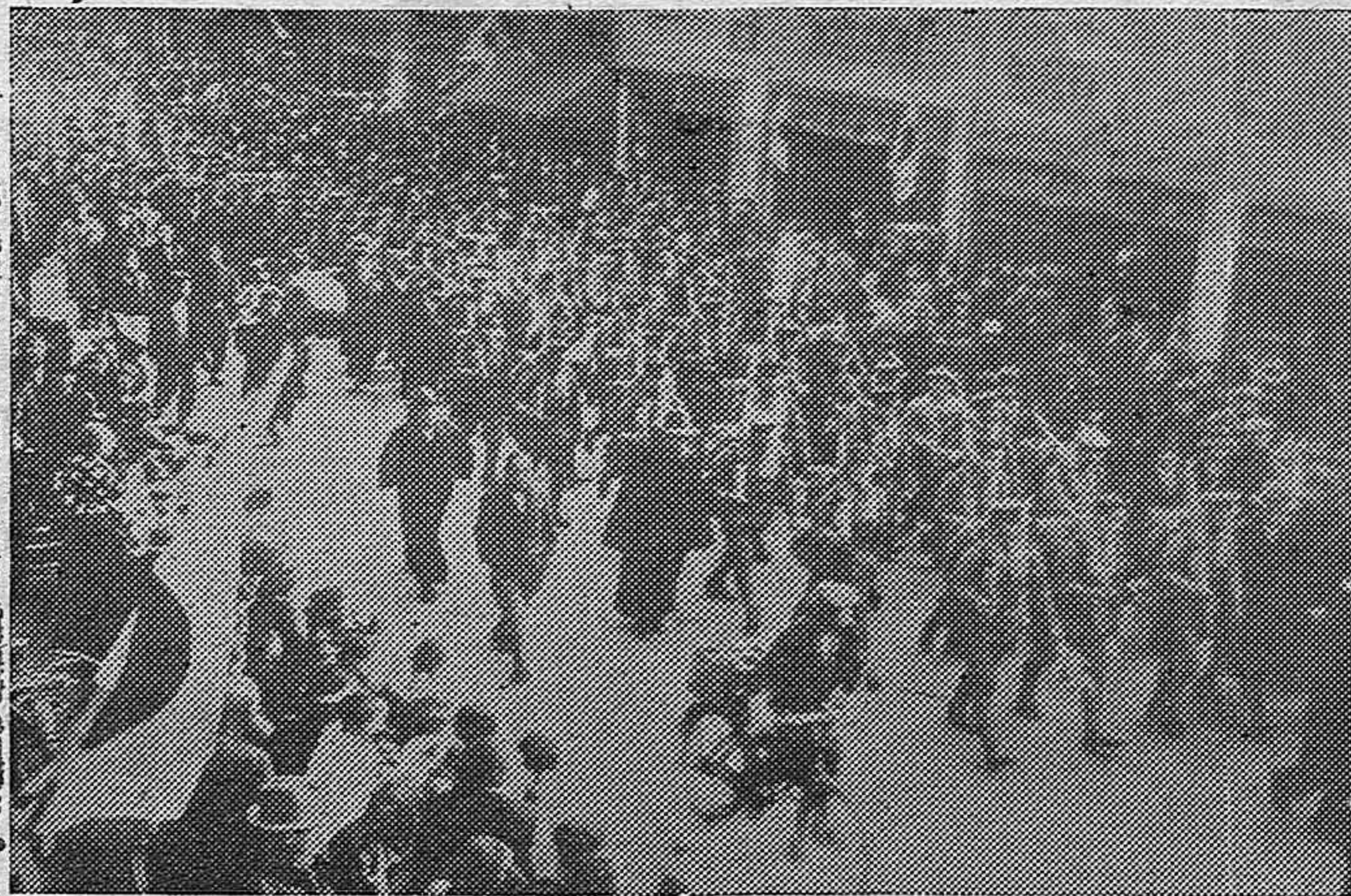
Tropas japonesas desfilando por las calles de Tokio, entre las aclamaciones del público.