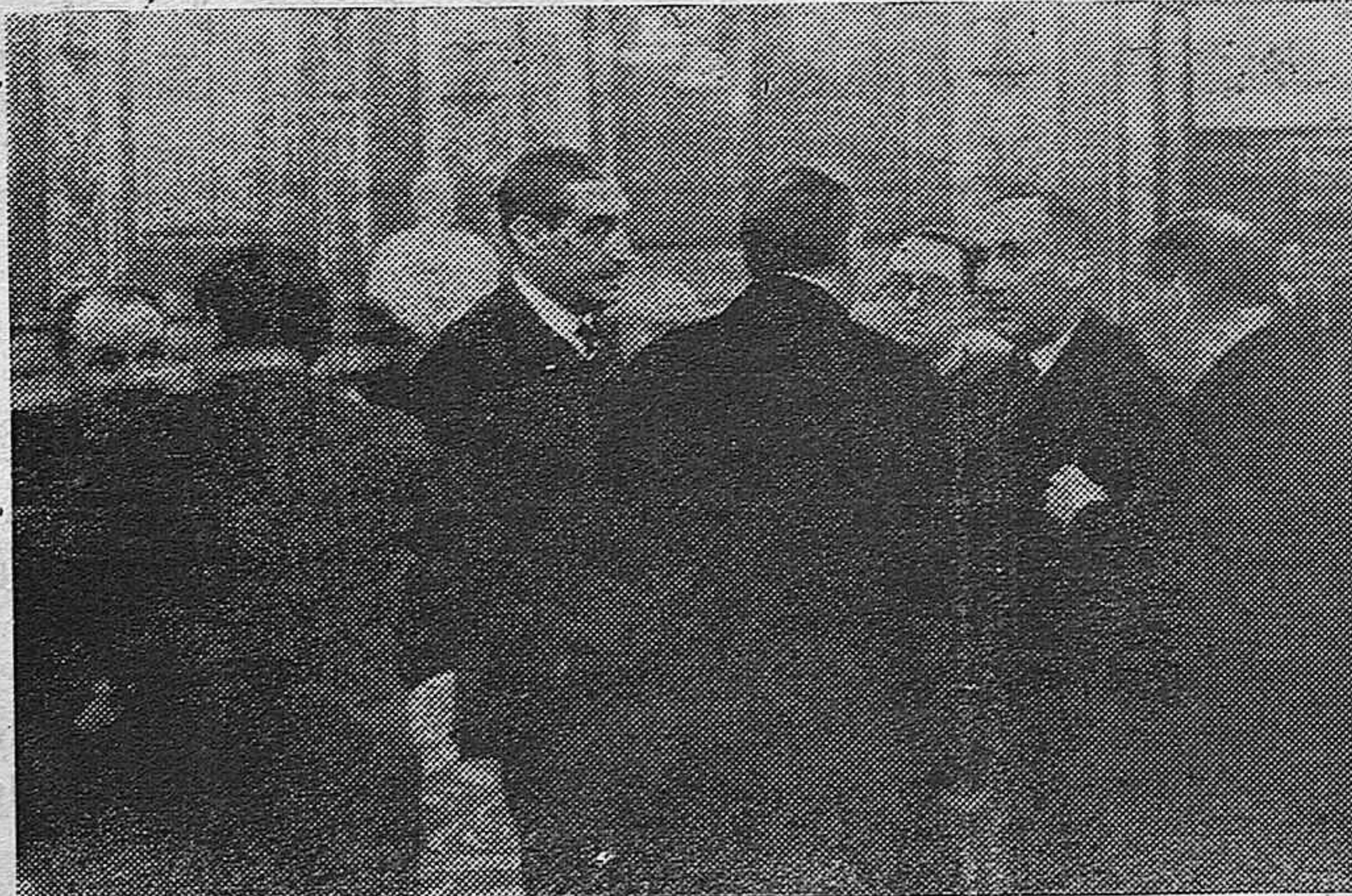
Los señores Maura, Martínez Barrios y Ventosa, comentando los resultados de la reunión de la Diputación Permanente.

CARMEN. — Tarde, a las seis, piadoso ejercicio de la Hora Santa y acto de consagración al Amor Misericordioso.