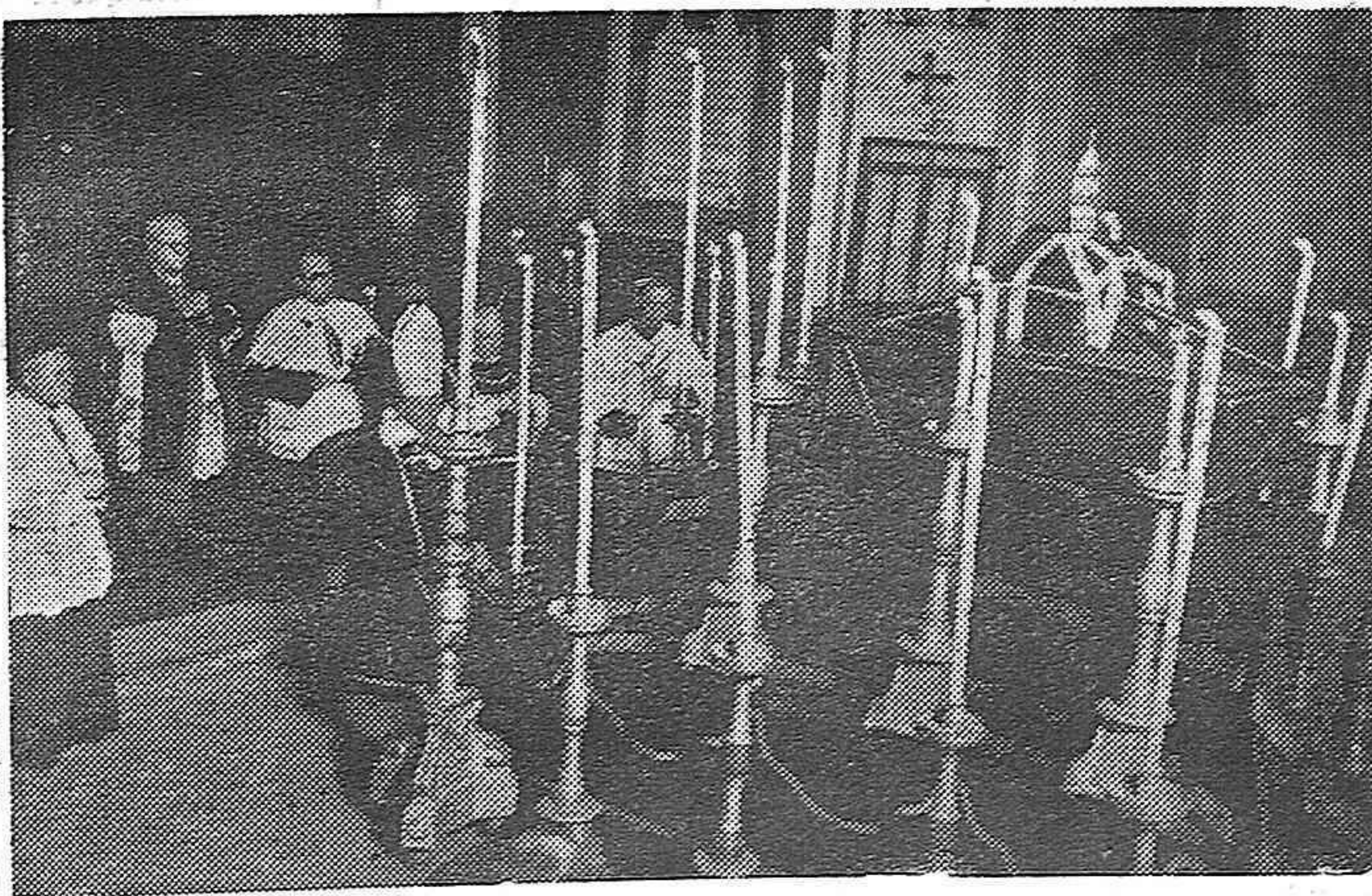
En la iglesia pontificia de Madrid han tenido lugar unas misas para el eterno descanso del alma del que fué Papa Benedicto XV (e. p. d.), oficiando el nuncio de Su Santidad, Monseñor Tedeschini.