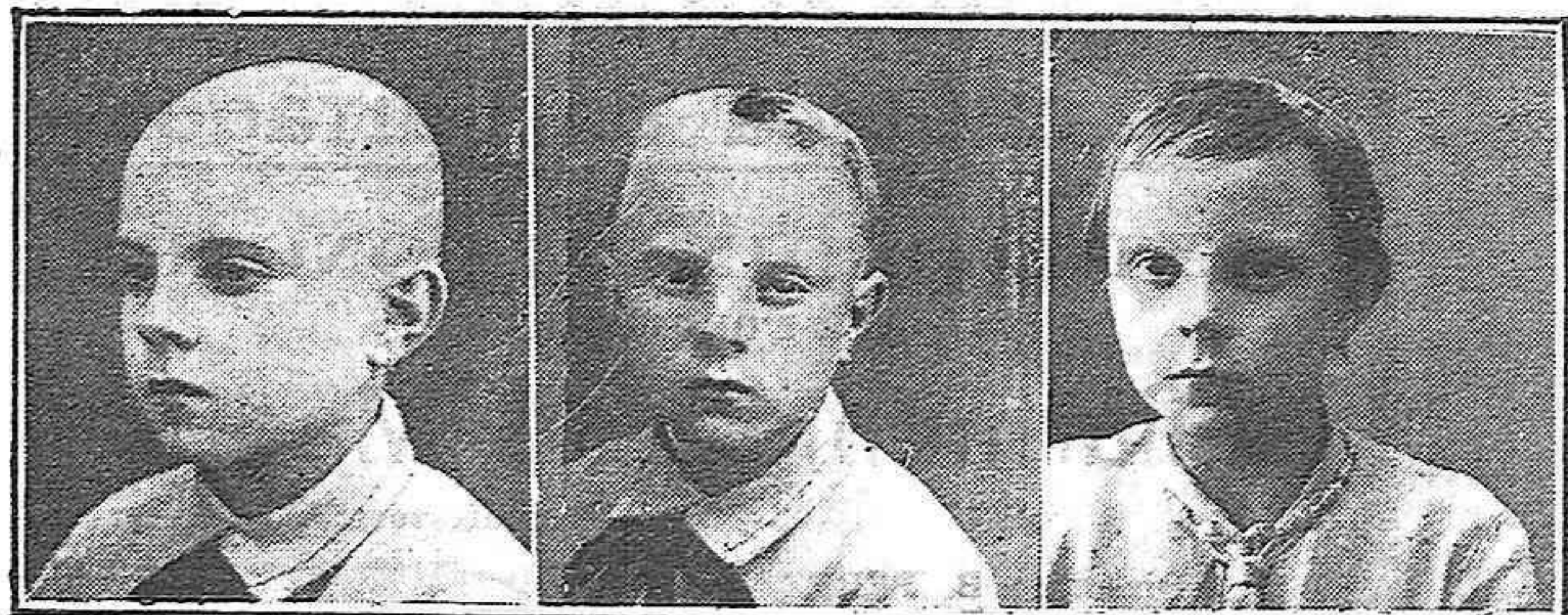
Calvo de nacimiento