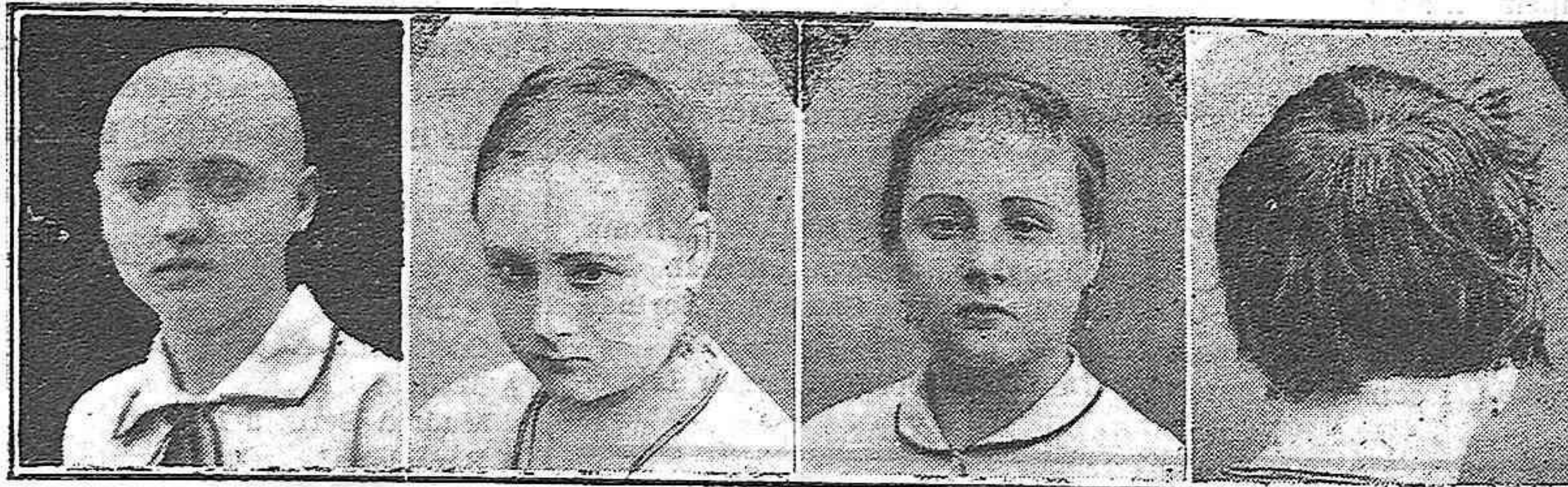
12 años calvo