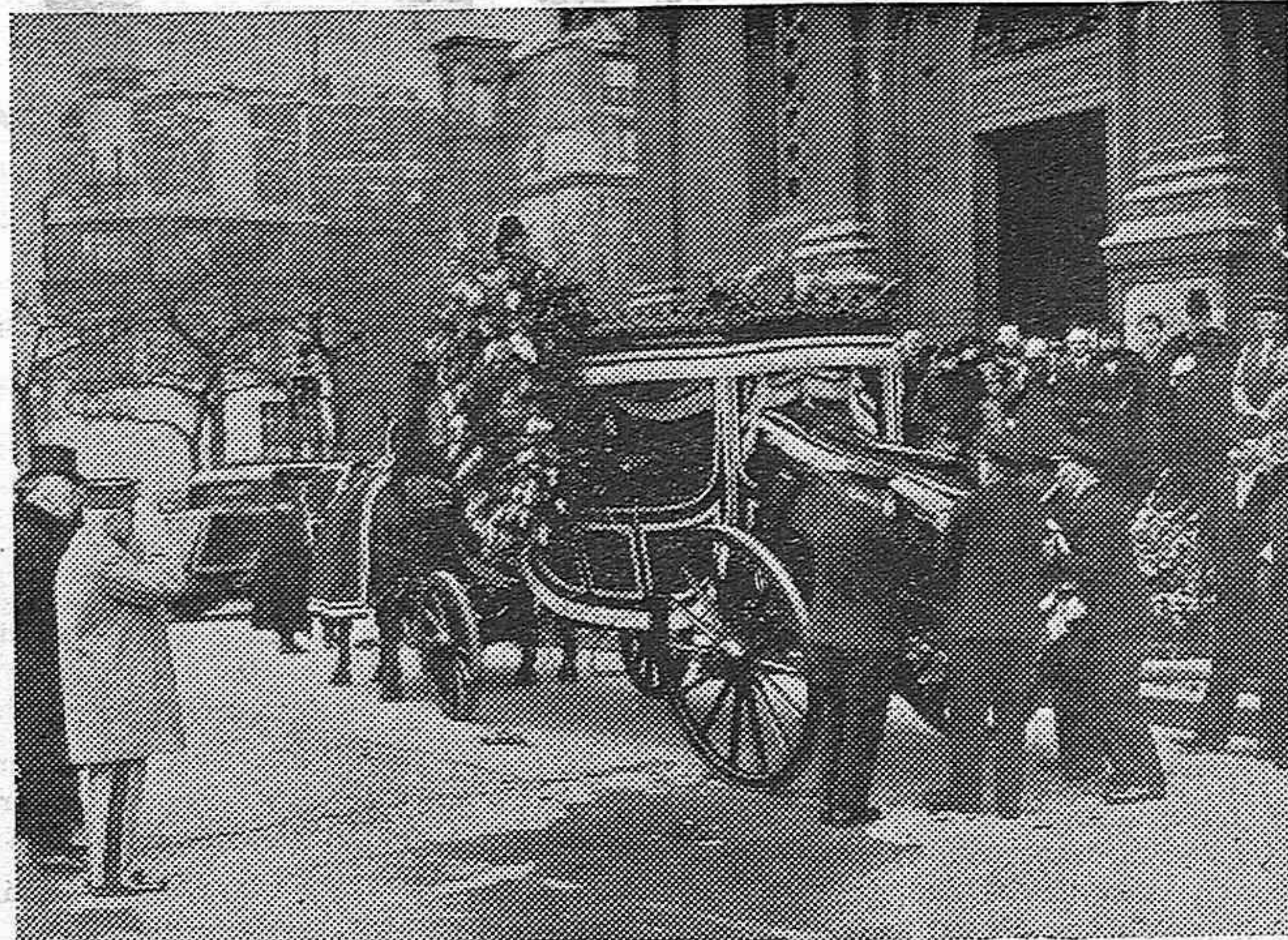
En la iglesia de San Francisco Javier de Paris, han tenido lugar las ceremonias religiosas de las honras fúnebres del célebre escritor Pablo Bourget. -- Llegada del féretro a la iglesia de San Francisco Javier, a la izquierda el mariscal Petain y el señor Enrique Bordeaux.