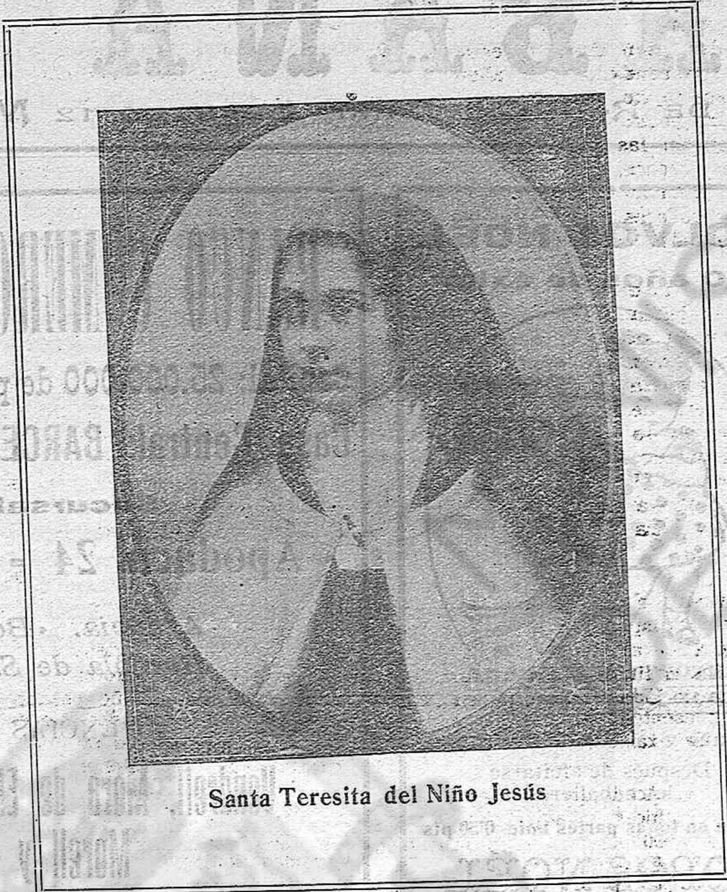
Santa Teresita del Niño Jesús

El texto del presente número ha sido sometido a la previa censura.