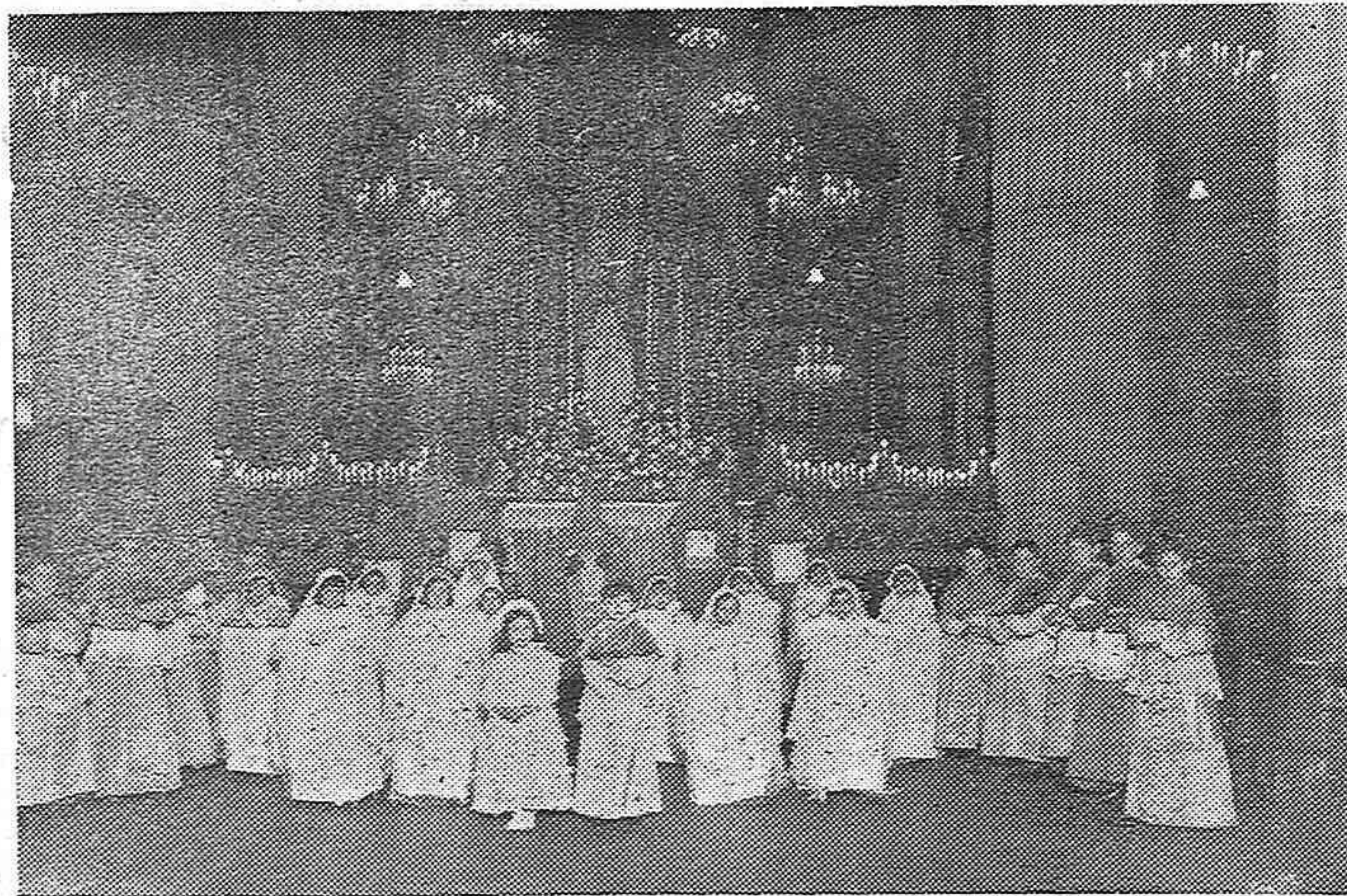
La catequesis del populoso barrio de Santiago, celebra con gran solemnidad la fiesta de la Purísima.

Procesión con la Purísima celebrada por la catequesis.