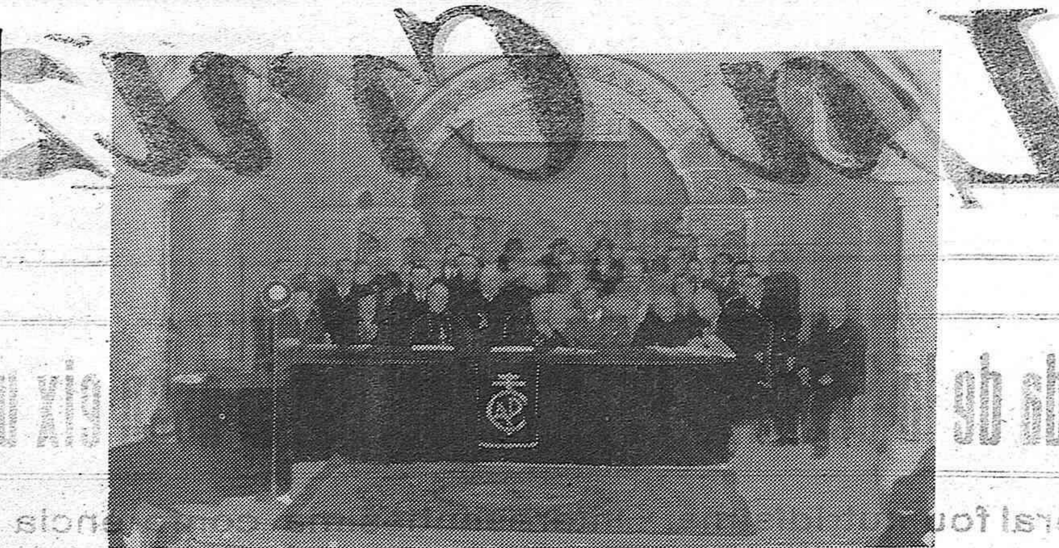
La presidencia en el acto de clausura

Dirigeix algunes observacions als pares, exhortant-los a que vigilin l'ensenyament dels infants. Teniu una planta molt delicada i moltes vegades no us doneu pas compte de que llurs fulles espanseixen i cauen. No deixeu els fills en mans d'altres,