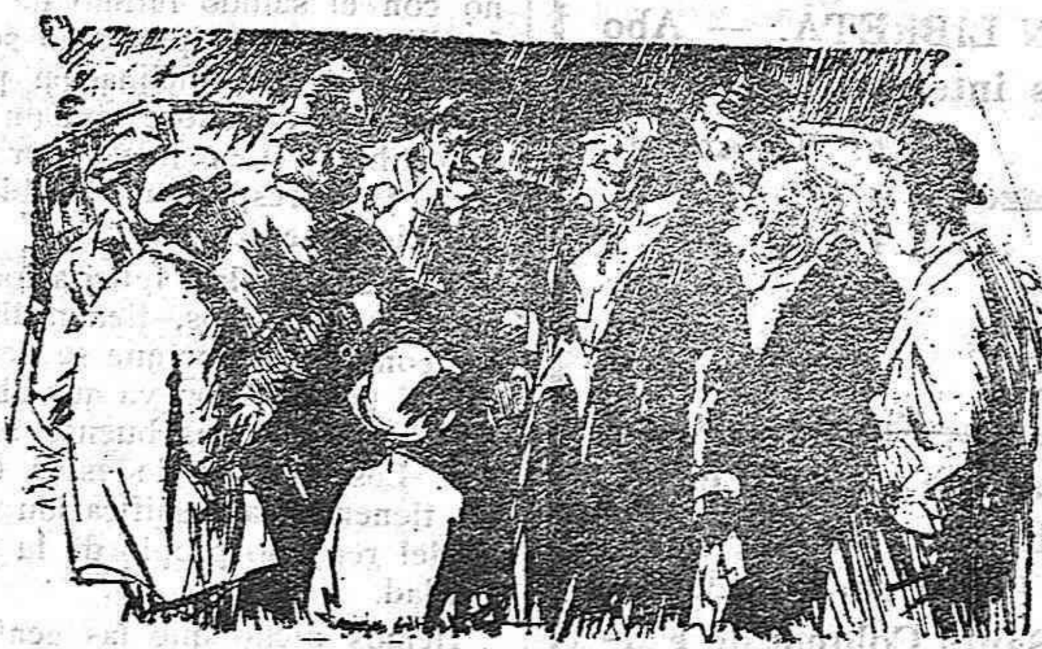
Policia. — Qui portava l'auto quan ha atropellat aquest home? El borrarxo. — Ningú. Tots quatre anàvem sentats al darrera.

Ahora no, ahora ha hablado a los catalanes sin adularlos, con valentía y defendiendo al gobierno frente a la pasión catalanista y ha presentado el problema regionalista en términos