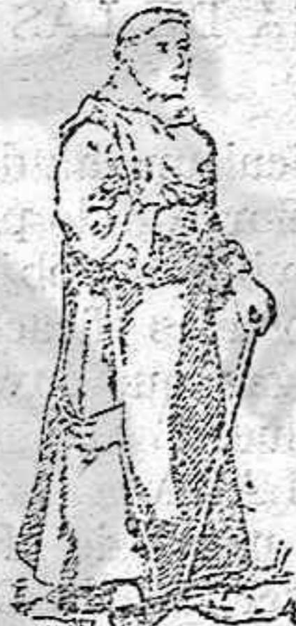
Le naturaliste prépare avec le respect le plus absolu le jus de la tisane pour les malades, vieillards et enfants.

compuesta únicamente de plantas medicinales