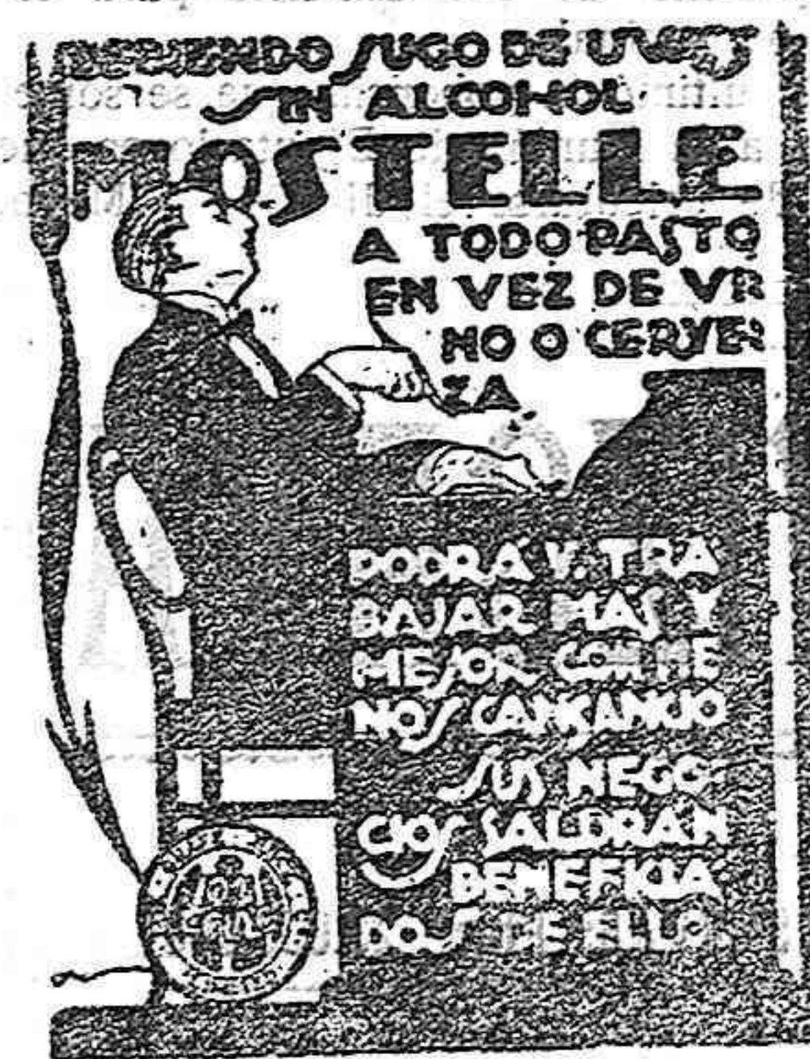
RAFAEL ESCOFET - TARRAGONA

Últimos días de la verdadera liquidación, de lor artículos loza, cristal, porcelana, objetos regalo, fantasía, et cétera. Aproveche comprar a estos precios. Conde de Rius (Hospital), núm. 13, bajos. Abierto de 9 a 12 y de 3 a 7.