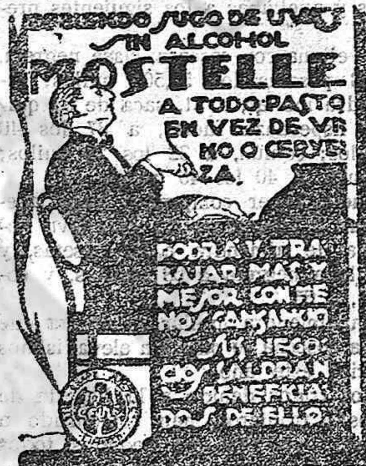
RAFAEL ESCOFET - TARRAGONA

Almacenes de Materiales Cerámicos de Construcción y Saneamiento