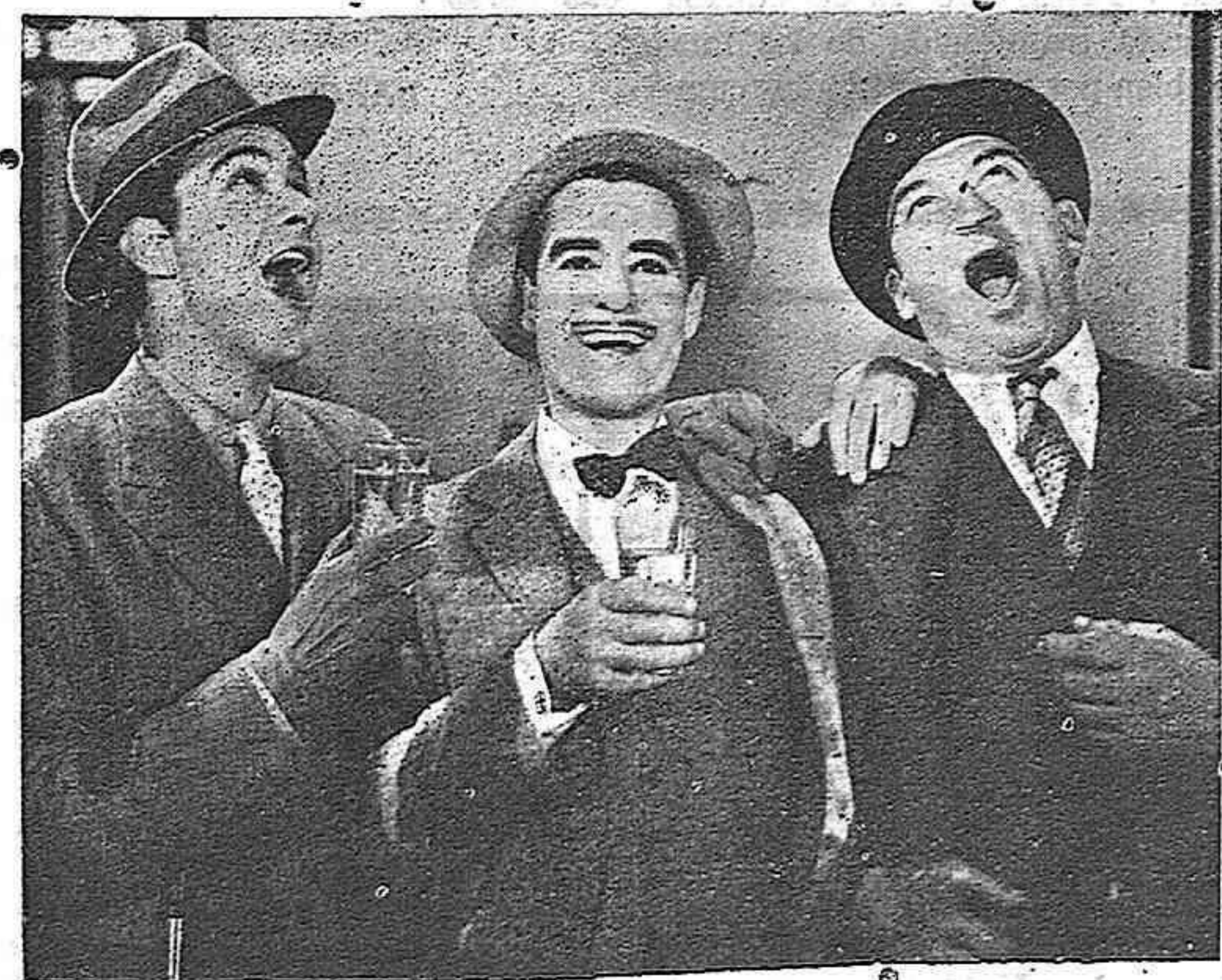
Una escena de la película Columbia-Cifesa "El capitán odia el mar", protagonizada por John Gilbert, Victor Mc. Laglen y Wynne Gibson.

democrático de la gente del pueblo. Pero, además, es que a este director le van admirablemente los asuntos en que el casticismo tiene matizaciones tan propias y pintorescas como los que se dan en "La Verbena de la Paloma". El Madrid de nuestros abuelos con sus verbenas, sus amorios bajo la pañosa o el airoso pañolón, van a revivir por la magia y el talento de Perojo en esta versión sonora que dentro de unas semanas comenzará a rodar, valiéndose de los propios escenarios que inspirara y conociera el genio chispeante y jocundo de Bretón.