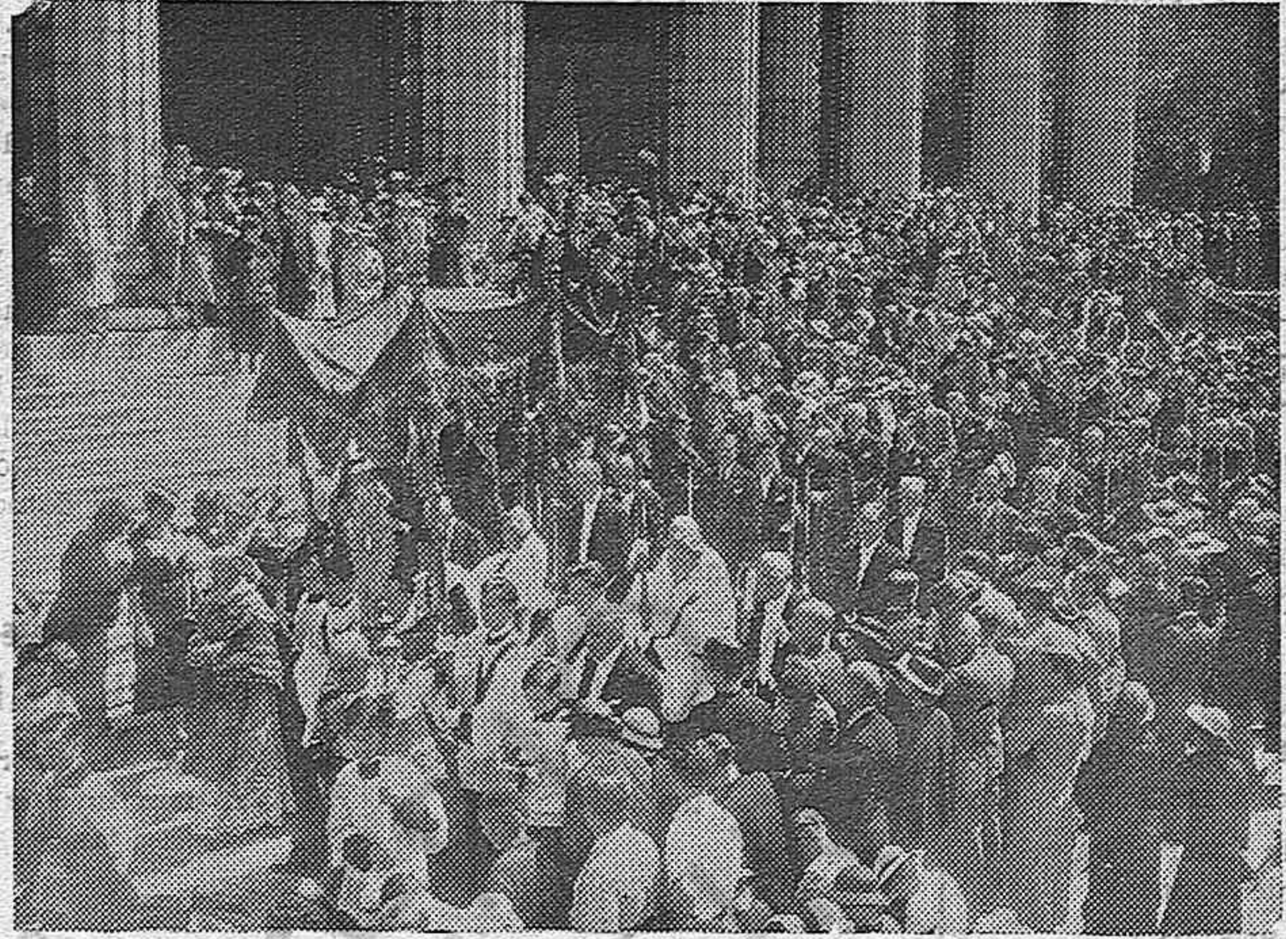
Con motivo de la festividad del Corpus, en la iglesia de la Magdalena de Paris, se celebró una brillante fiesta terminando con una procesión. La procesión saliendo de la Magdalena.