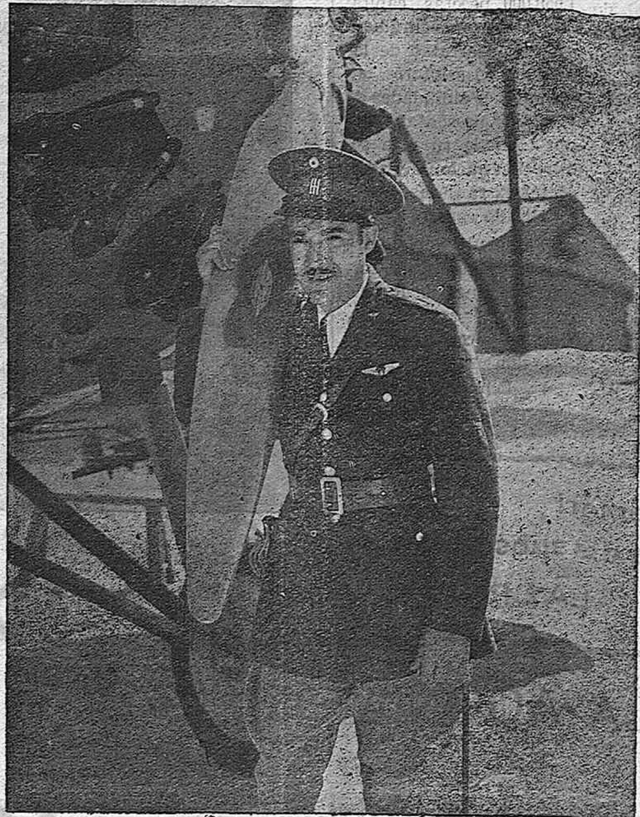
El notable actor Ramón Pereda en la producción mejicana "El vuelo de la muerte" de CIFESA