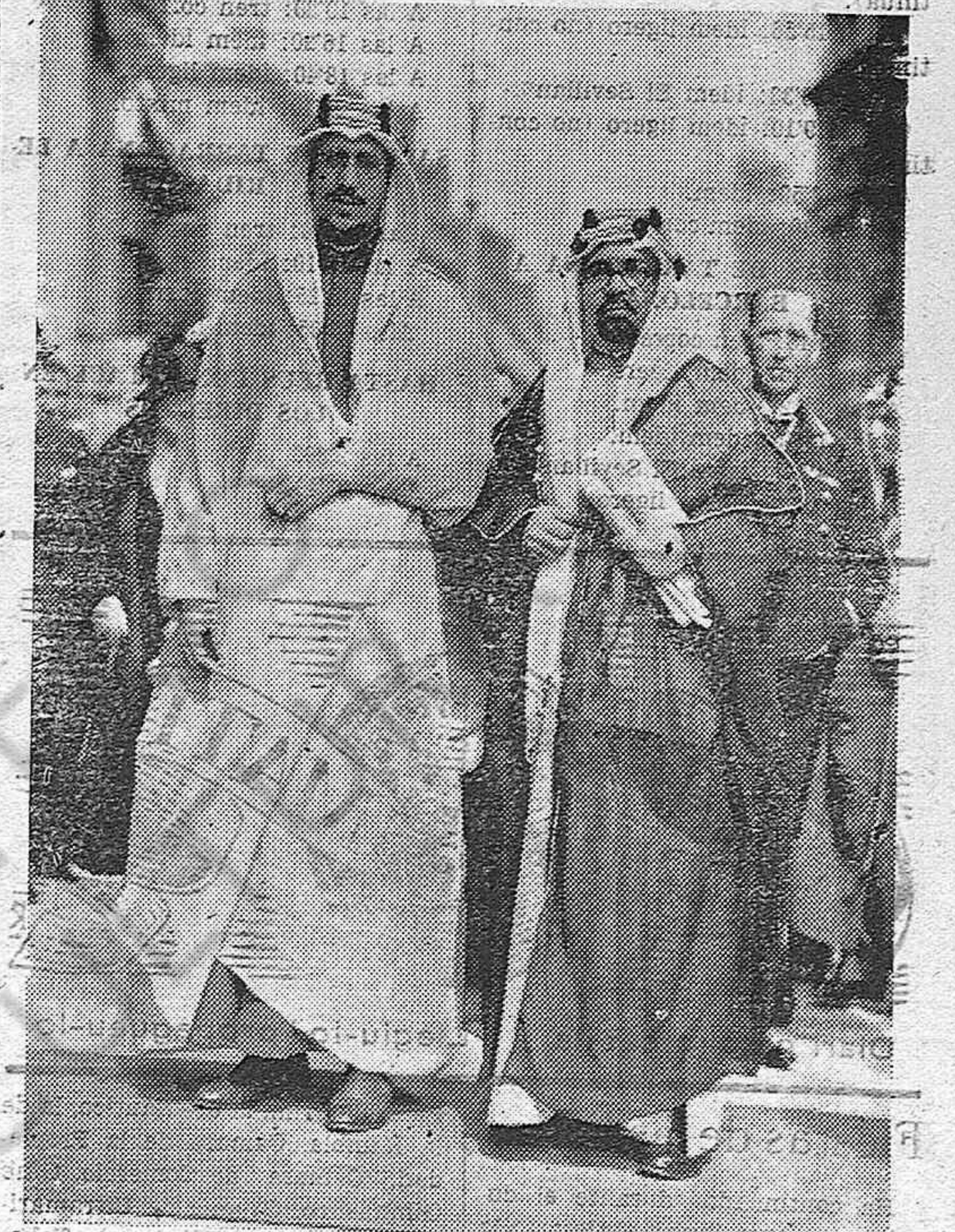
Emir Saud, hijo mayor y heredero del rey Ibn Saud de Arabia, llegó a Londres donde fué recibido con todos los honores. A la estación acudieron representantes del Gobierno británico. Emir Saud salvó la vida de su padre el rey Ibn Saud el cual era víctima de un atentado en Mecca hace algunas semanas.