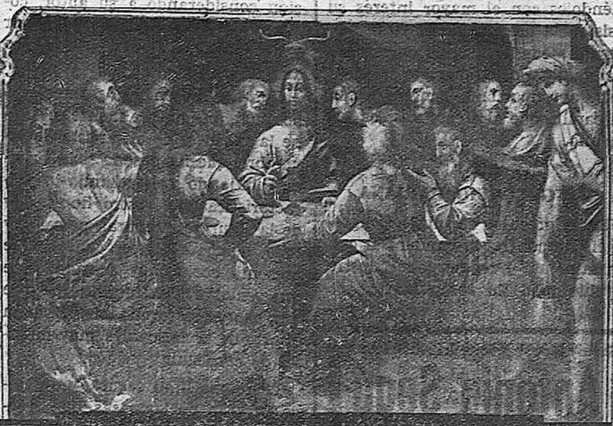
Interessant pintura que embelleix l'altar de la Capella del Santissim de la nostra Seu

Per tal d'evitar confusions, les capelles estaran tancades durant la processó i s'obriran, després, a petició de les associacions interessades. Com les esmentades capelles estaran tancades fins a les sis de la tarda, hi haurà a cada una de les naus laterals un encarregat d'obrir les respectives capelles a l'arribada de les diferents associacions.