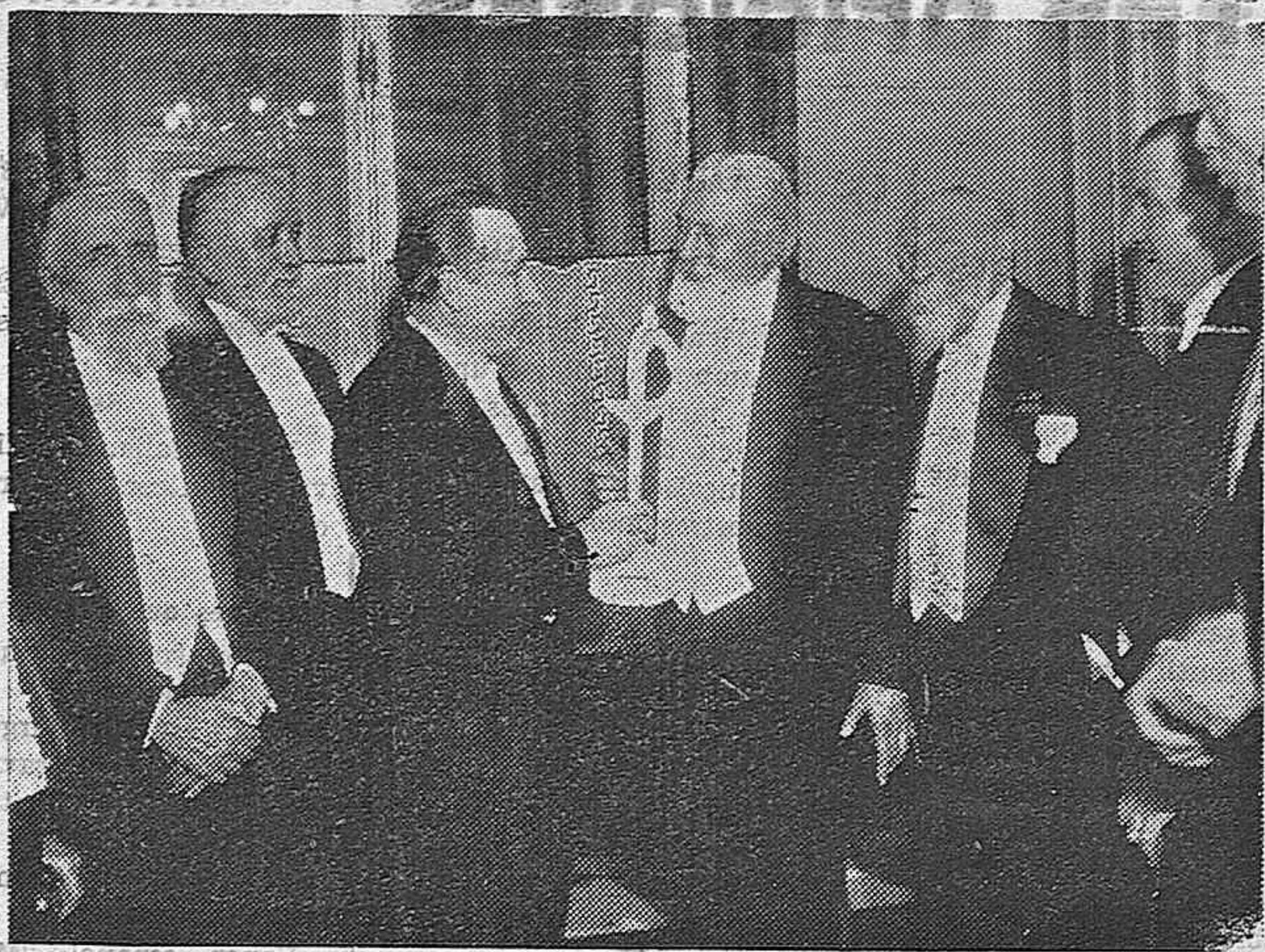
Por iniciativa de la Asociación de escritores combatientes, durante la comida que le fué ofrecida en el Palacio d'Orsay, el brillante escritor Claudio Farrere, recibió la maqueta de su espada de académico.