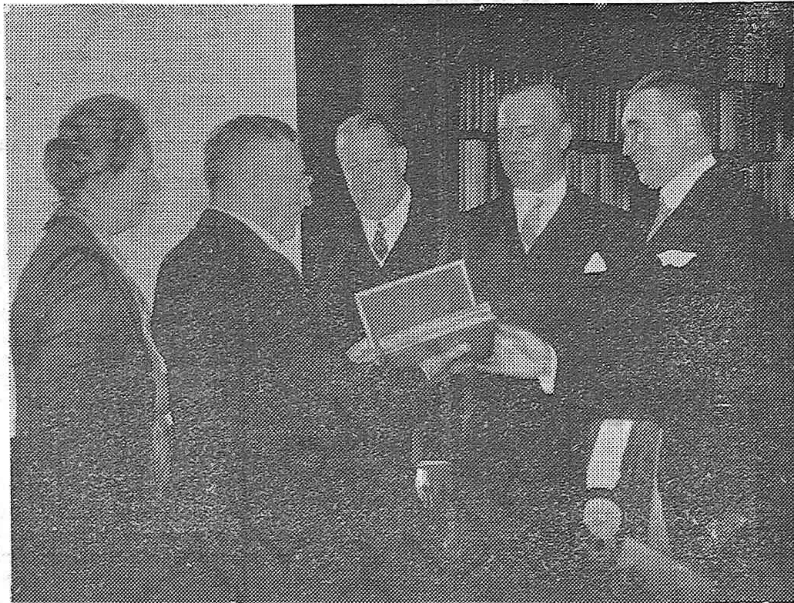
Después de muchos años de expediciones exploradoras en la lejana Asia, a su llegada a Estocolmo fué obsequiado con un manuscrito en conmemoración del 70.º aniversario de su nacimiento por la Sociedad Geográfica de Suecia.