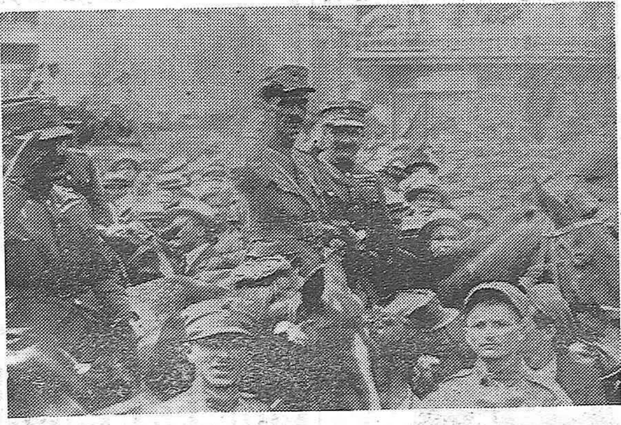
El general Plastiras, que ha sido animador de varias revoluciones en Grecia y que desde hace algún tiempo habitaba en Cannes ha salido inmediatamente para Grecia al tener noticias de la revolución.

Actualmente se tiene noticia de que ha salido de Italia (Brindisi). El general Plastiras, en una de las últimas revoluciones, aclamado por la multitud.