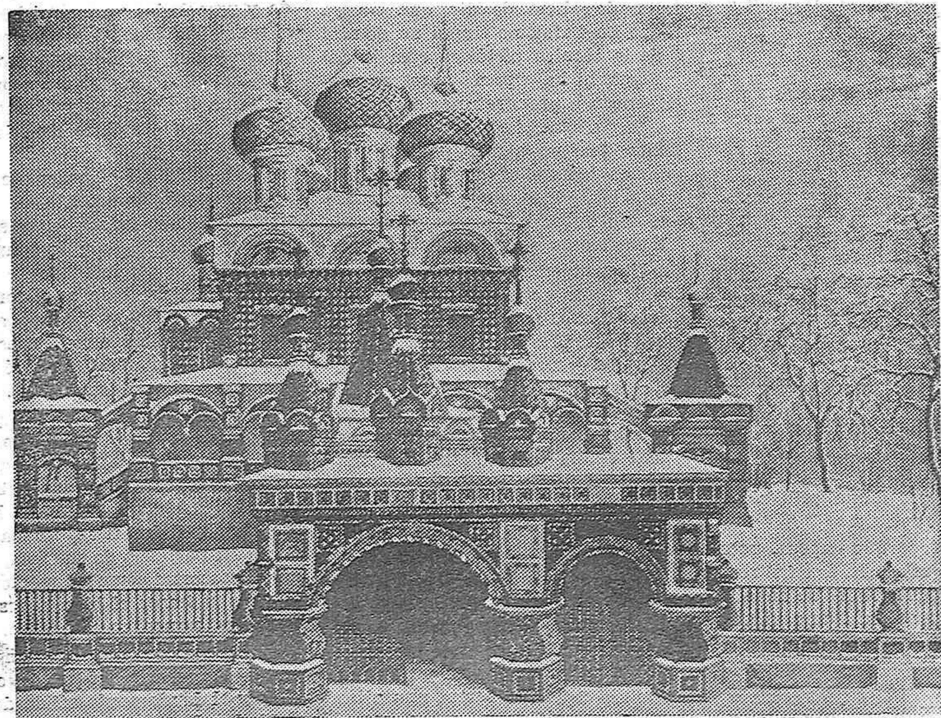
Actualmente tiene lugar en el Vaticano una notable exposición de arte religioso ruso que ha sido inaugurada con una importante ceremonia.

LA CRUZ se complace en adherirse efusivamente a los elogios justificados que el colega dedica a la personalidad del Obispo dertusense, esperando que su actuación será fructífera en el campo de la Acción Católica.