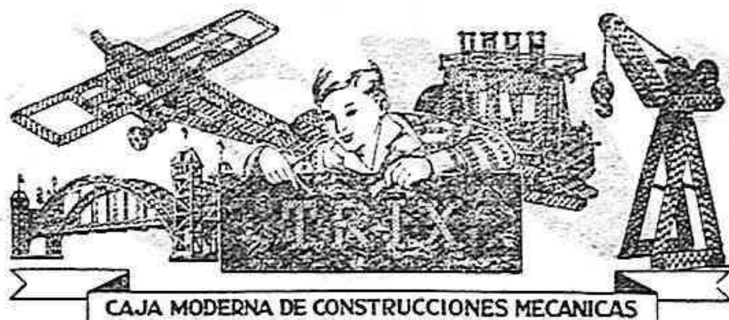
CAJA MODERNA DE CONSTRUCCIONES MECANICAS