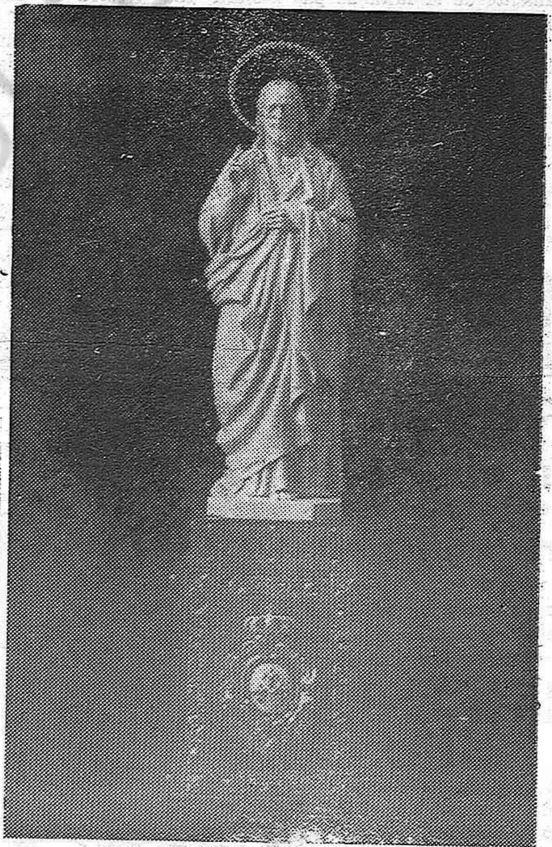
Imagen del Sagrado Corazón de Jesús, de marfil con brillantes y zafiros, que los mayordomos de semana de la antigua casa real, regalan a doña Beatriz de Borbón con motivo de su enlace.