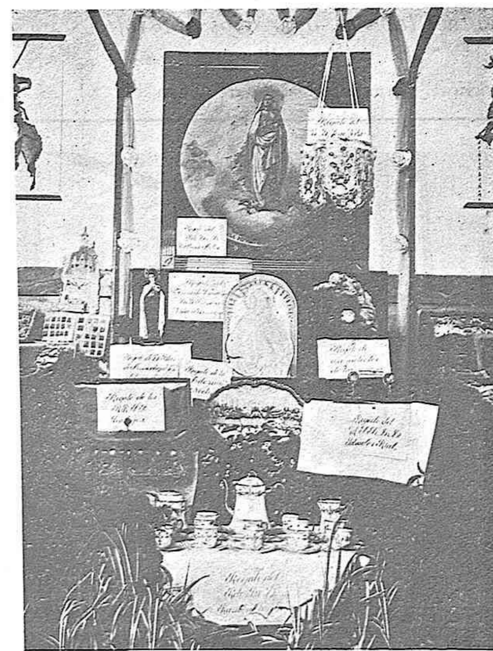
Exposición misional del Seminario P. de Tarragona. Ricos premios para el sorteo.

En estos momentos hay más misioneros protestantes que ministros católicos. Tened en cuenta que aquéllos cuentan con diez y siete mil auxiliares indígenas. ¡Contad con que reciben veinte veces