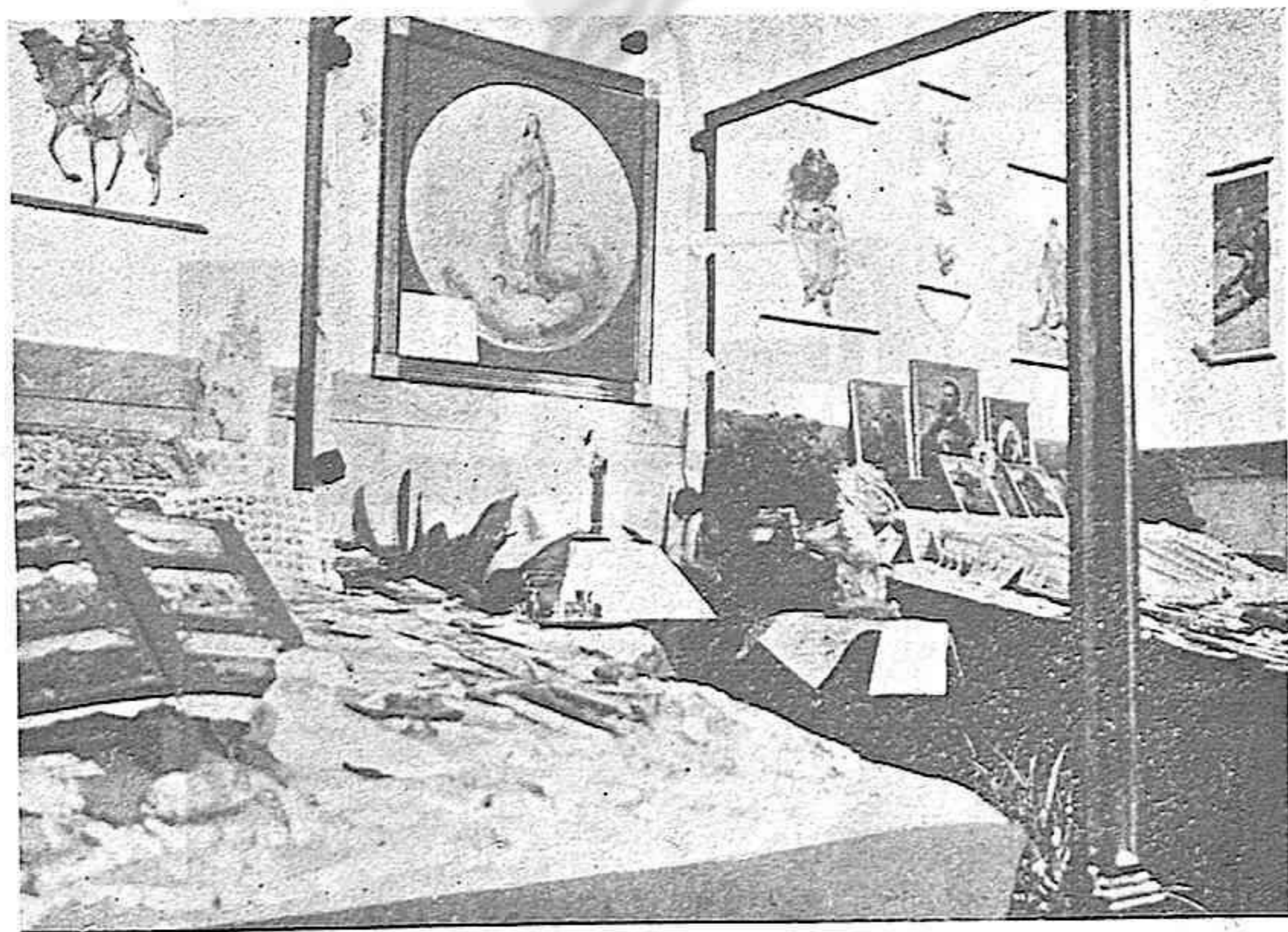
Exposición misional del Seminario P. de Tarragona. Sección de objetos destinados a las misiones de infieles.

(De la Encíclica "Rerum Ecclesiae", del Papa Pío XI, 28 Febrero 1926.)