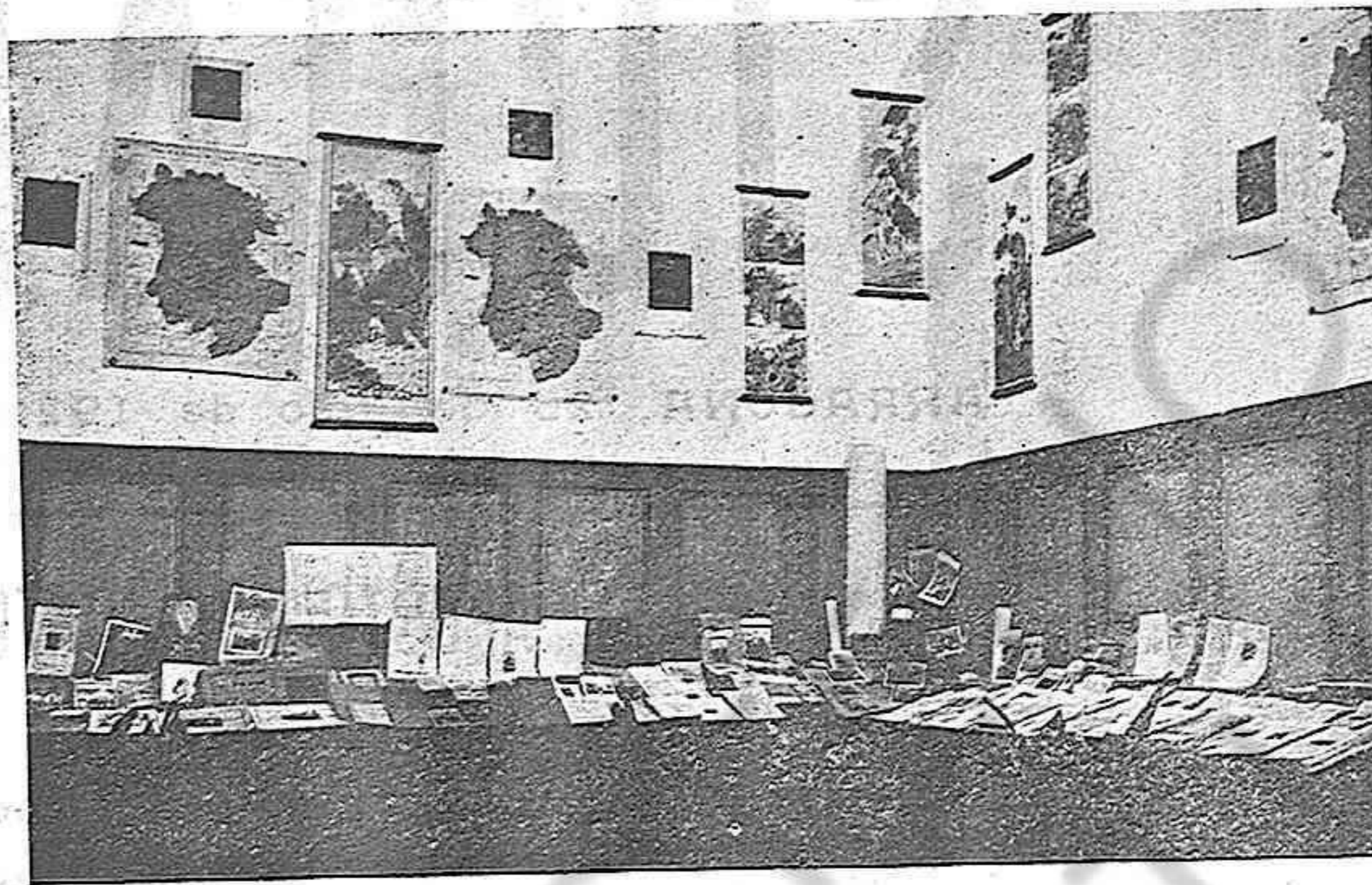
Exposición misional del Seminario P. de Tarragona. Sección de libros y objetos de propaganda.

que se dedican exclusivamente o en gran parte al apostolado, ya proporcionando directa o indirectamente recursos a los misioneros.