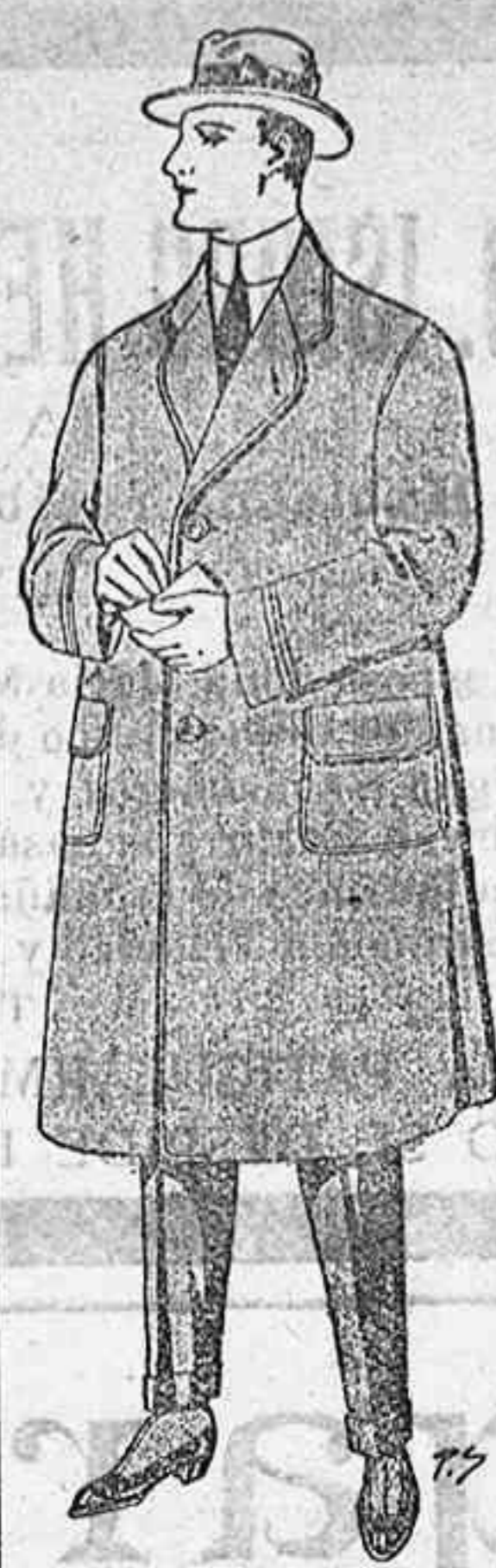
Gabanes a medida desde

Les altres peses, que l'autor te aprovades les envia, copiades a ma, amb sa firma y saigell a qui les demani.