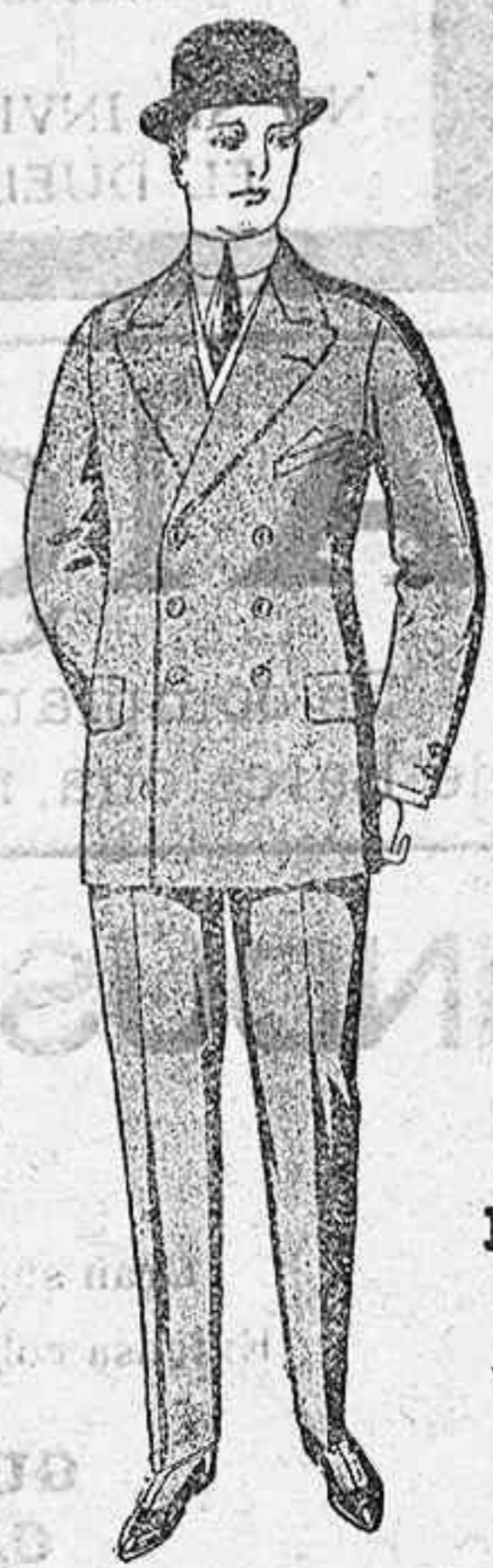
Gabanes a medida desde