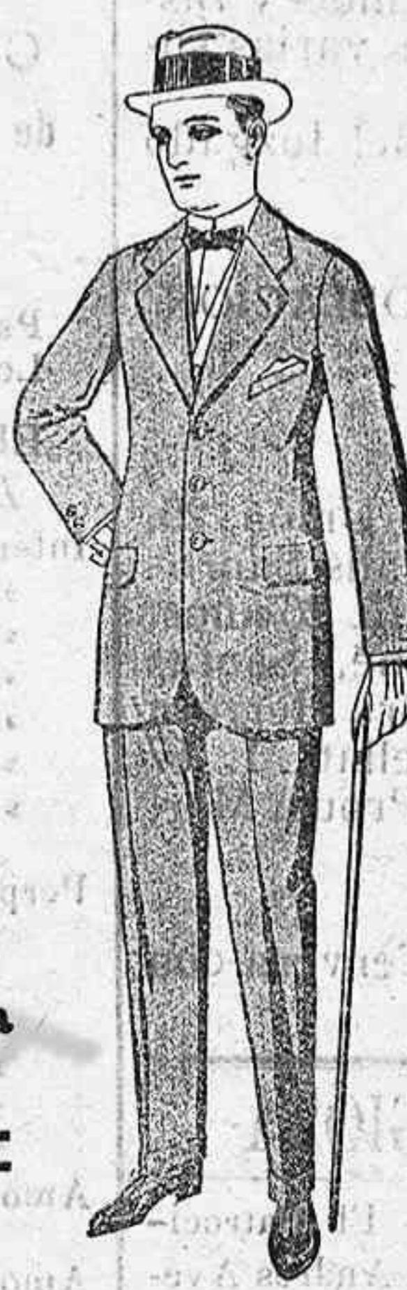
FIJESE V. EN LOS PRECIOS