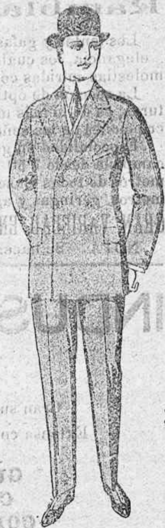
FIGÉSE V. EN LOS PRECIOS GABAN CABALLERO Clase extra 1.ª 35. 2.ª 27.50 3.ª 20. Gabanes a medida desde 50.