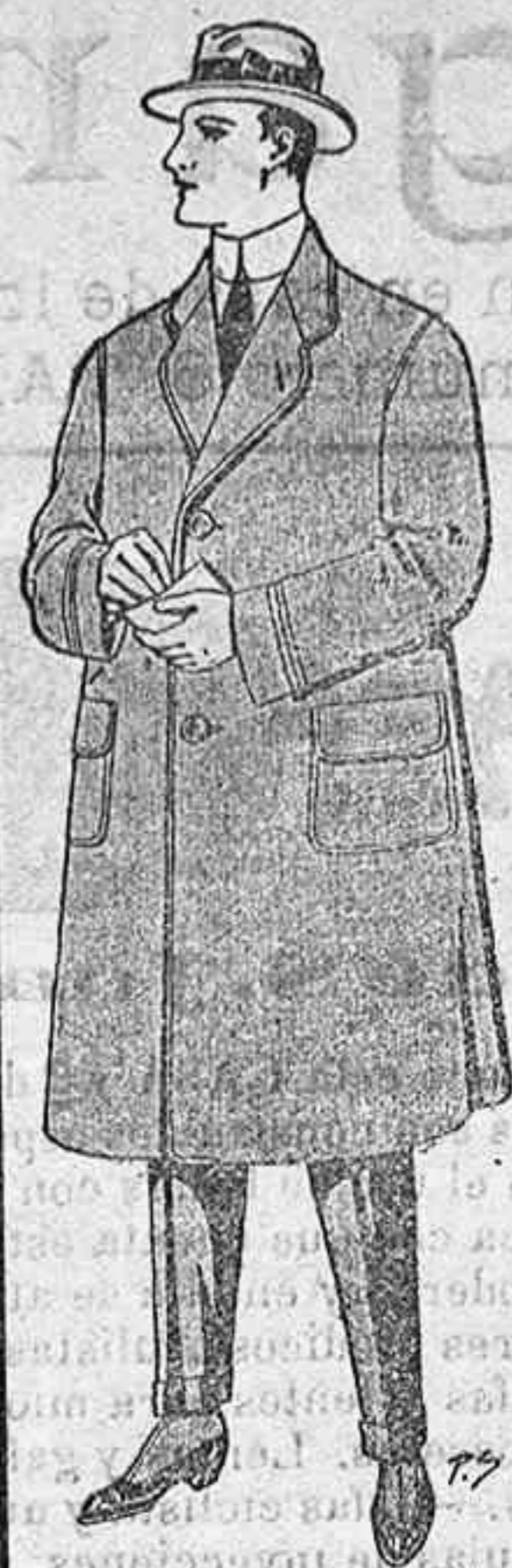
FIGÉSE V. EN LOS PRECIOS GABAN CABALLERO Clase extra 1.ª 35. 2.ª 27.50 3.ª 20. Gabanes a medida desde 50.

Les altres pessets, que l'autor te aprovades les envia, copiades a ma, amb sa firma y sigell a qui les demani.