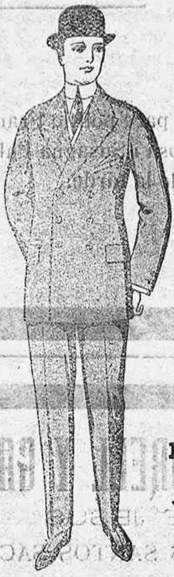
Gabanes a medida desde