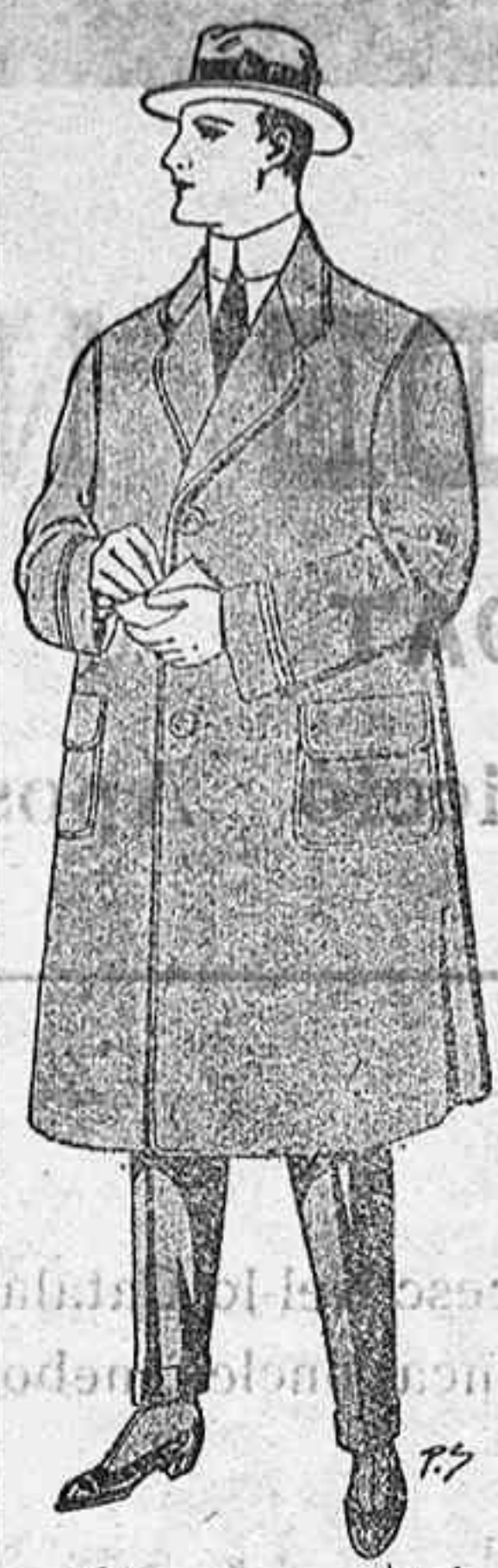
Gabanes a medida desde

A los que no envíen ni siquiera los quince céntimos se les dejará de enviar la Revista, entendiéndose que no la leen o que no quieren recibirla.