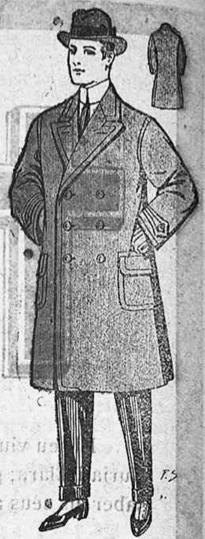
FÍJESE V. EN LOS PRECIOS

VISITARLA ES CONVENCERSE Bajada Misericordia, 5