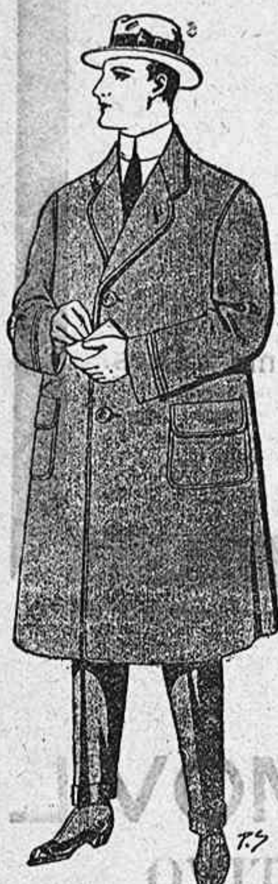
Gabanes a medida desde

La casa que posee la exclusiva en toda España es la “CASA MALÉ,”