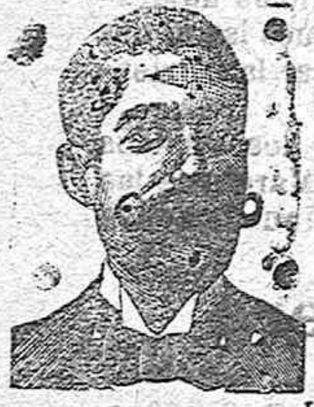
A. SALVATI COSTANZI Calle Diputación 435 BARCELONA

0 INYECCION ANTIVENÉREOS COSTANZI Y ROOB ANTISIFILITICO