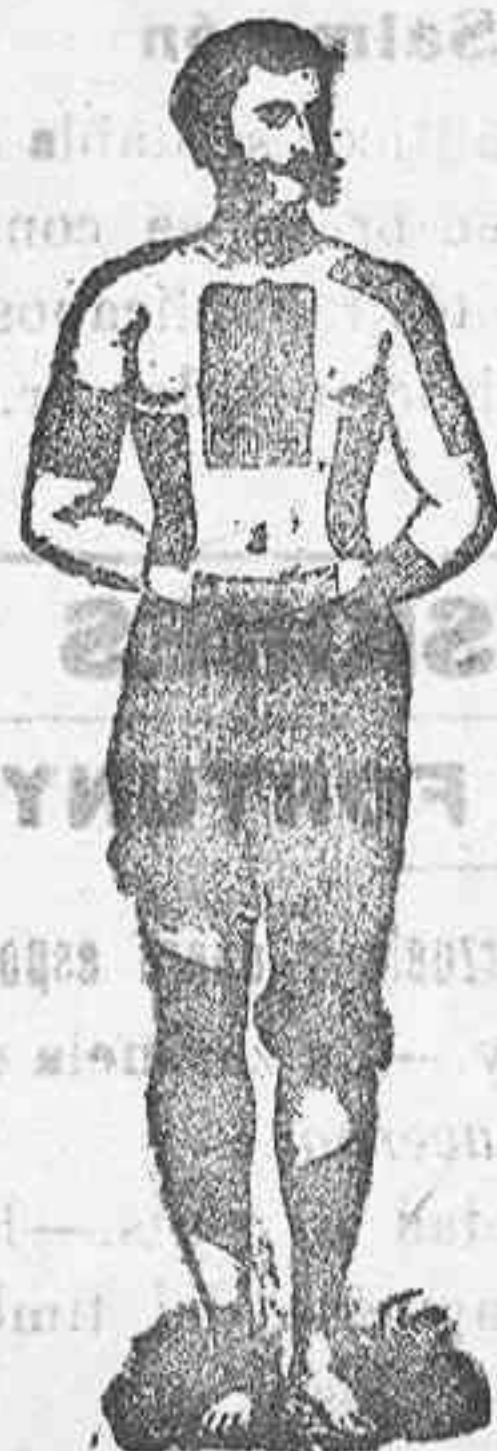
Trade Mark Registered. Los emplastos de feltro rojo, del Dr. Winter, son los únicos verdaderos y eficaces. Cuidado con las imitaciones. Escriba siempre la marca del Dr. Winter. Cura como por encanto. Boticas y Droguerías.

Curan reumatismo, resfriados, dolor de riñones, dolor de espalda, dolor de pulmones, lumbago, ciática, contusiones, etc., etc.