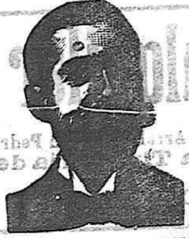
A. SALVATI COSTANZI Calle Diputación 435 BARCELONA