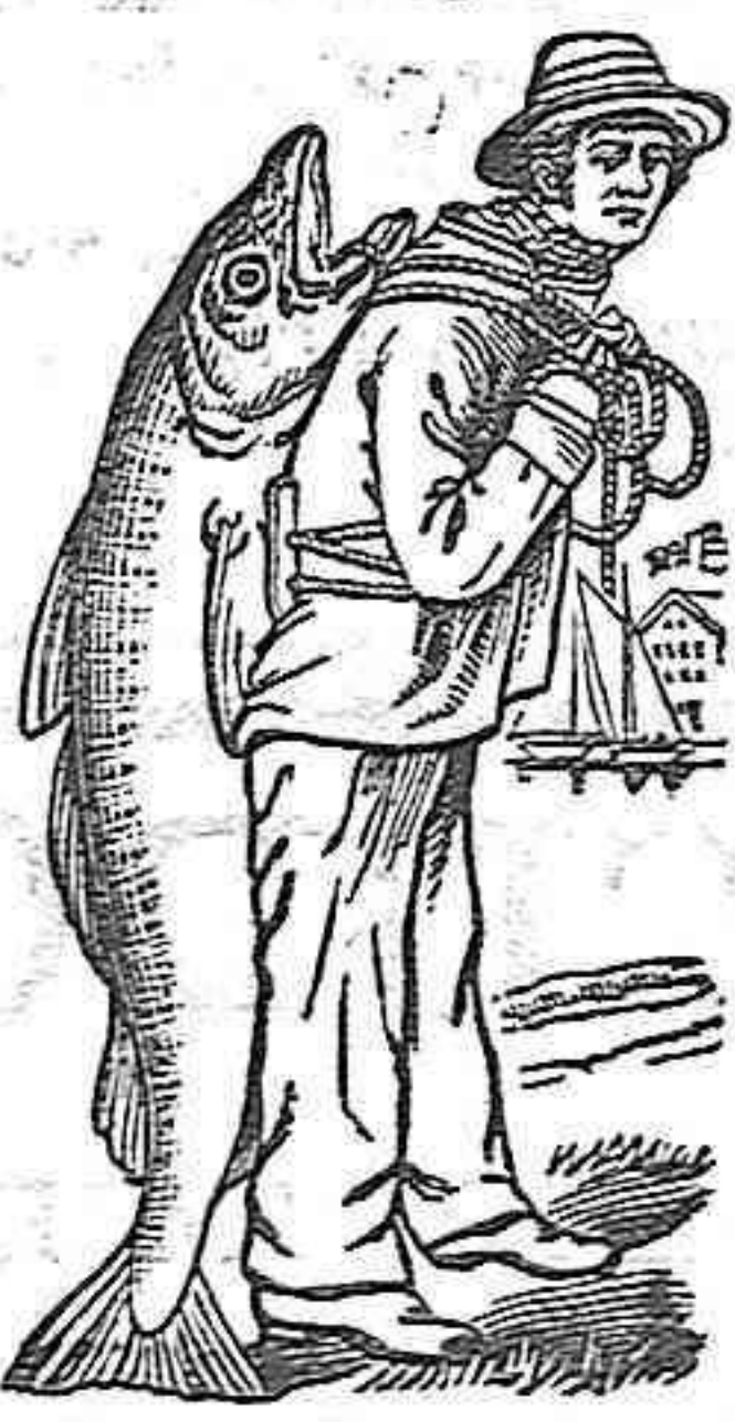
MANCA DE FABRICA

La Emulsión Scott se vende en todas las buenas farmacias y droguerías. Una muestra de prueba, facsímil de nuestros frascos, se envía gratis á quien la pida á D. Carlos Marés, calle de Valencia, 427, Barcelona, acompañando 50 centimos en sellos de correo para pago de franquicia.