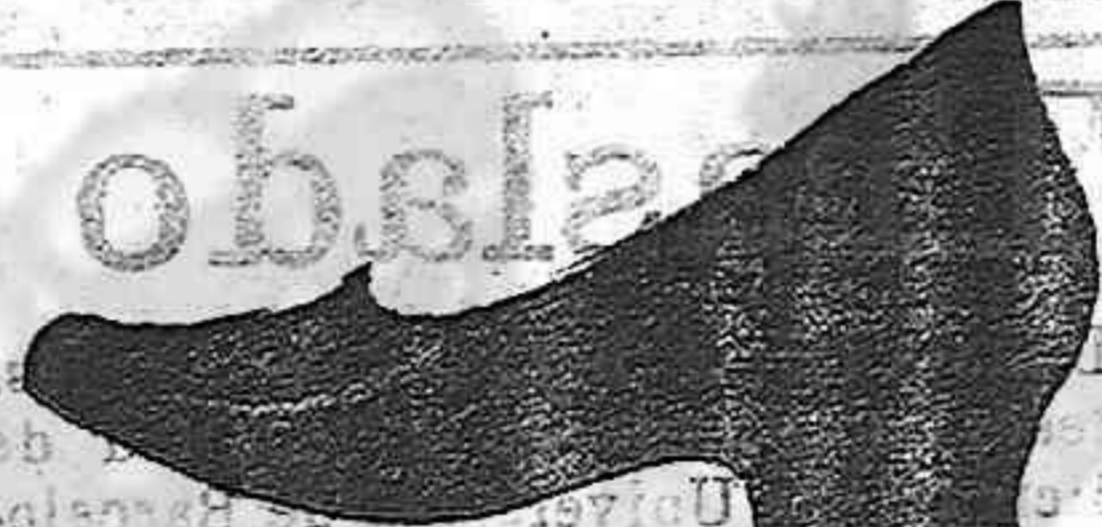
Señora, 5 50 pets.