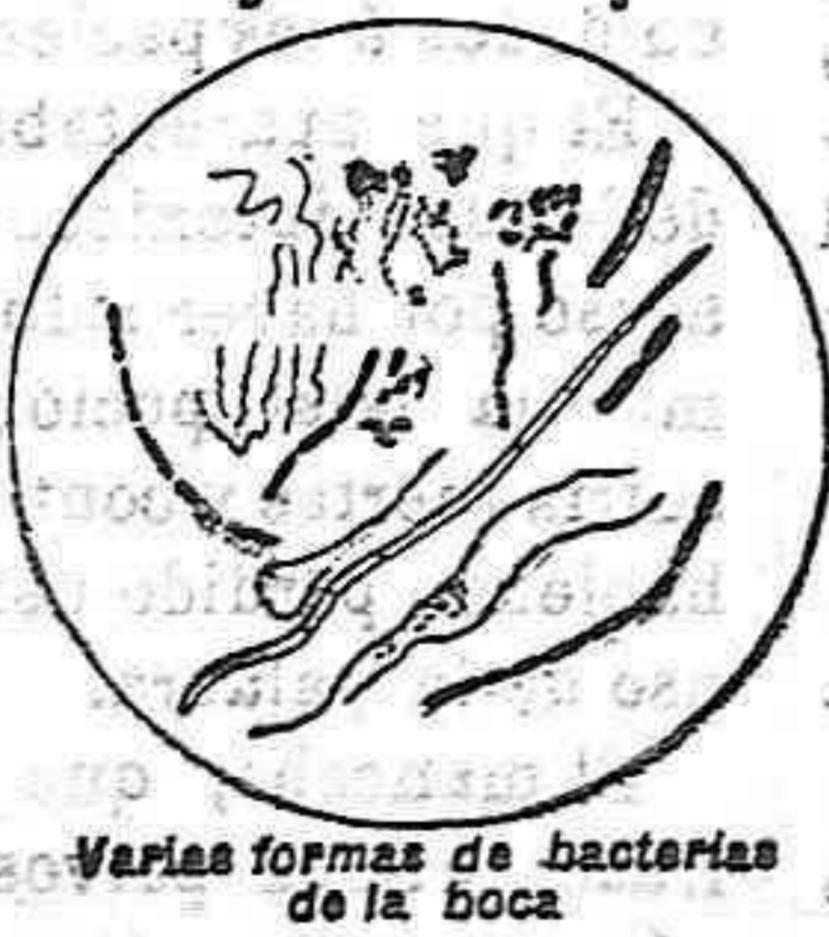
Varias formas de bacterias de la boca

De ahí se deduce lógicamente, para toda persona dotada hasta de mediana inteligencia, que si se quiere preservar los dientes del peligro de cariarse, es preciso reducir a la impotencia esas bacterias. Hace un siglo, cuando aparecieron la mayor parte de los dentífricos todavía usados hoy día, se ignoraban totalmente la existencia y los trabajos de estos microbios, que hoy por confesión unánime de los sabios del mundo entero, son reconocidos como causantes de la descomposición y de la caries de los dientes. No se puede decir, pues, que hoy por confesión unánime de los sabios del mundo entero, son reconocidos como causantes de la descomposición y de la caries de los dientes. No se puede decir, pues, que hoy por confesión unánime de los sabios del mundo entero, son reconocidos como causantes de la descomposición y de la caries de los dientes.