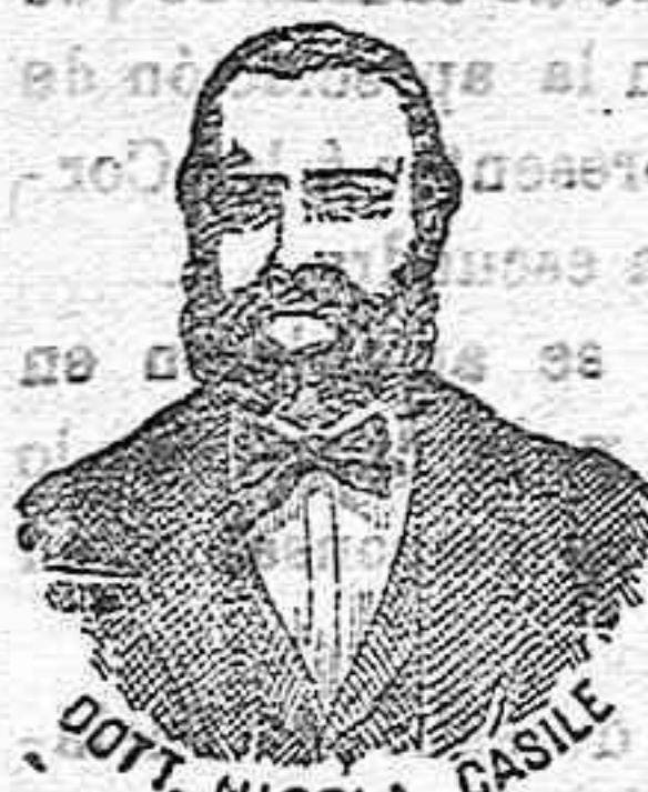
Inventor de los renombrados medicamentos CASILE

Agente: D. ROMÁN MUSOLAS, calle de Apodaca, 38.-Tarragona