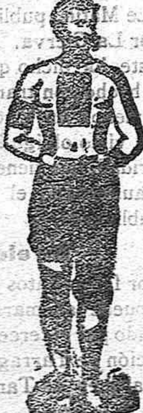
Tradic Mark Registrada. Estos emplastos de fieltro rojo, del Dr. Winter, son los únicos verdaderos y eficaces. Cuidado con las imitaciones. Enjuague siempre la marca del Dr. Winter. Cúrate como por encanto. Botellas y paquetes.

Los EMPLASTOS perforados americanos de fieltro rojo del Dr. Winter, infunden saludable corriente por todo el cuerpo, á instantáneas mitigan los dolores, tranquilizan los nervios, fortalecen los músculos debilitados, devuelven á los enfermos la salud. Estos EMPLASTOS especiales sirven para: aliviar los dolores de los miembros, los dolores de las articulaciones, las contusiones, etc., etc.