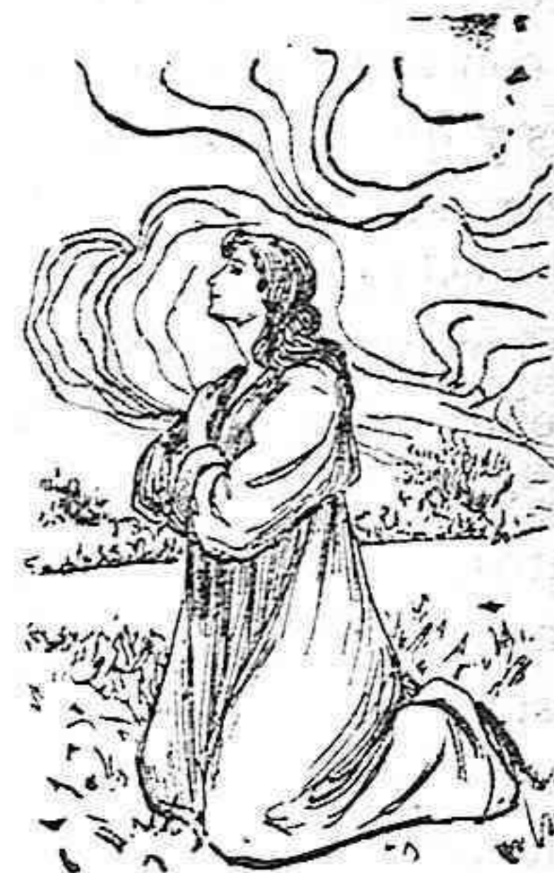
Martirologio: SANTA IRENE

Nació en Nabancia (Portugal). Educada por un tío suyo, abad del Monasterio de Santa María, solamente salía de su casa para frecuentar los sagrados templos.