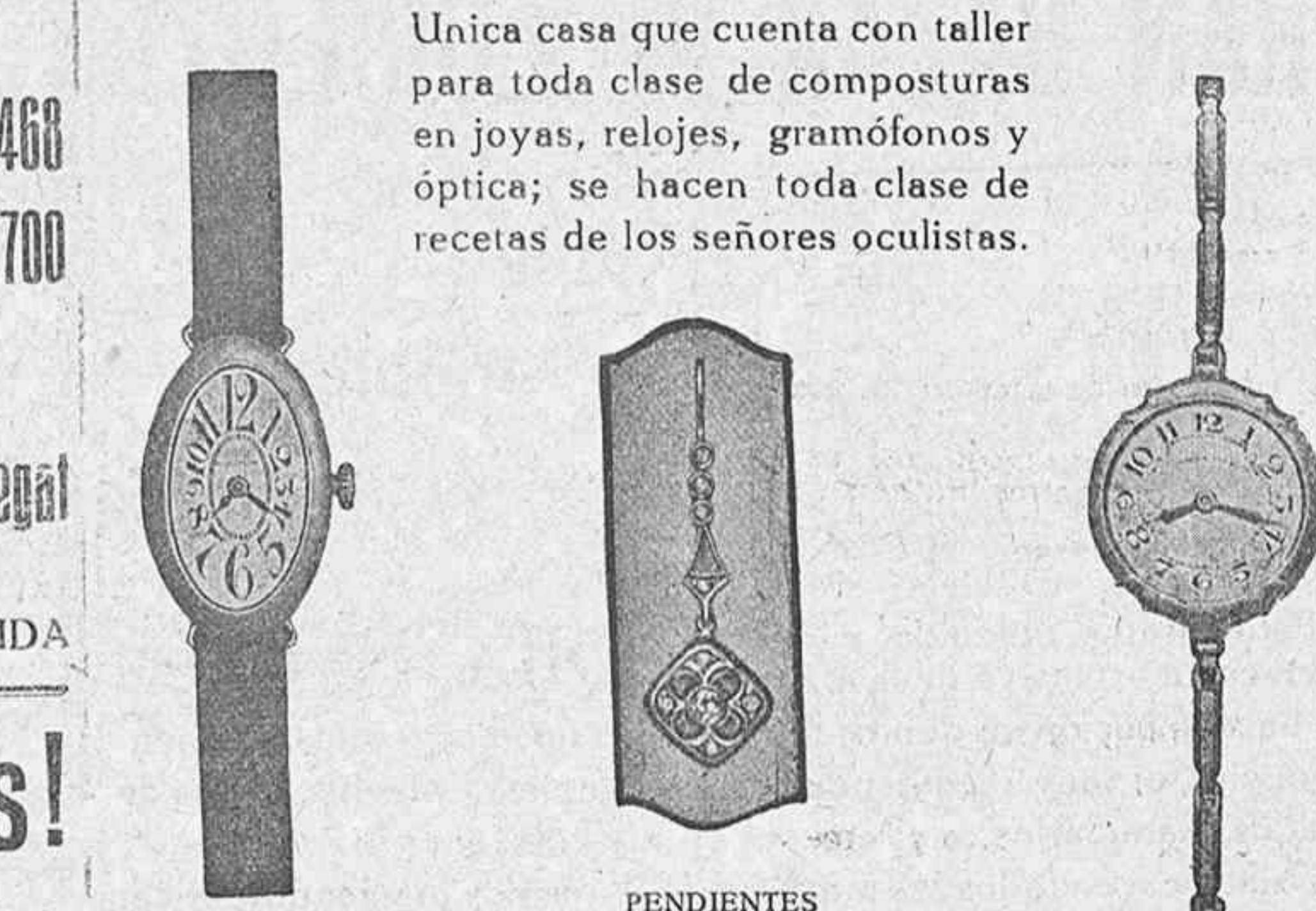
CHAPADO Desde 60 pesetas PENDIENTES Oro Ley 18 Kilates con 16 Diamantes Desde 40 pesetas CHAPADO Desde 18 pesetas

Unica casa que cuenta con taller para toda clase de composturas en joyas, relojes, gramófonos y óptica; se hacen toda clase de recetas de los señores oculistas.