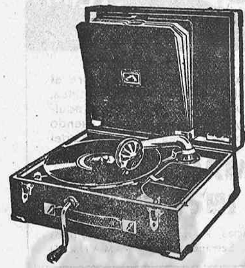
GRAMOLA, 210 ptas.

hay establecidos precios económicos a base de marcas de reconocido nombre