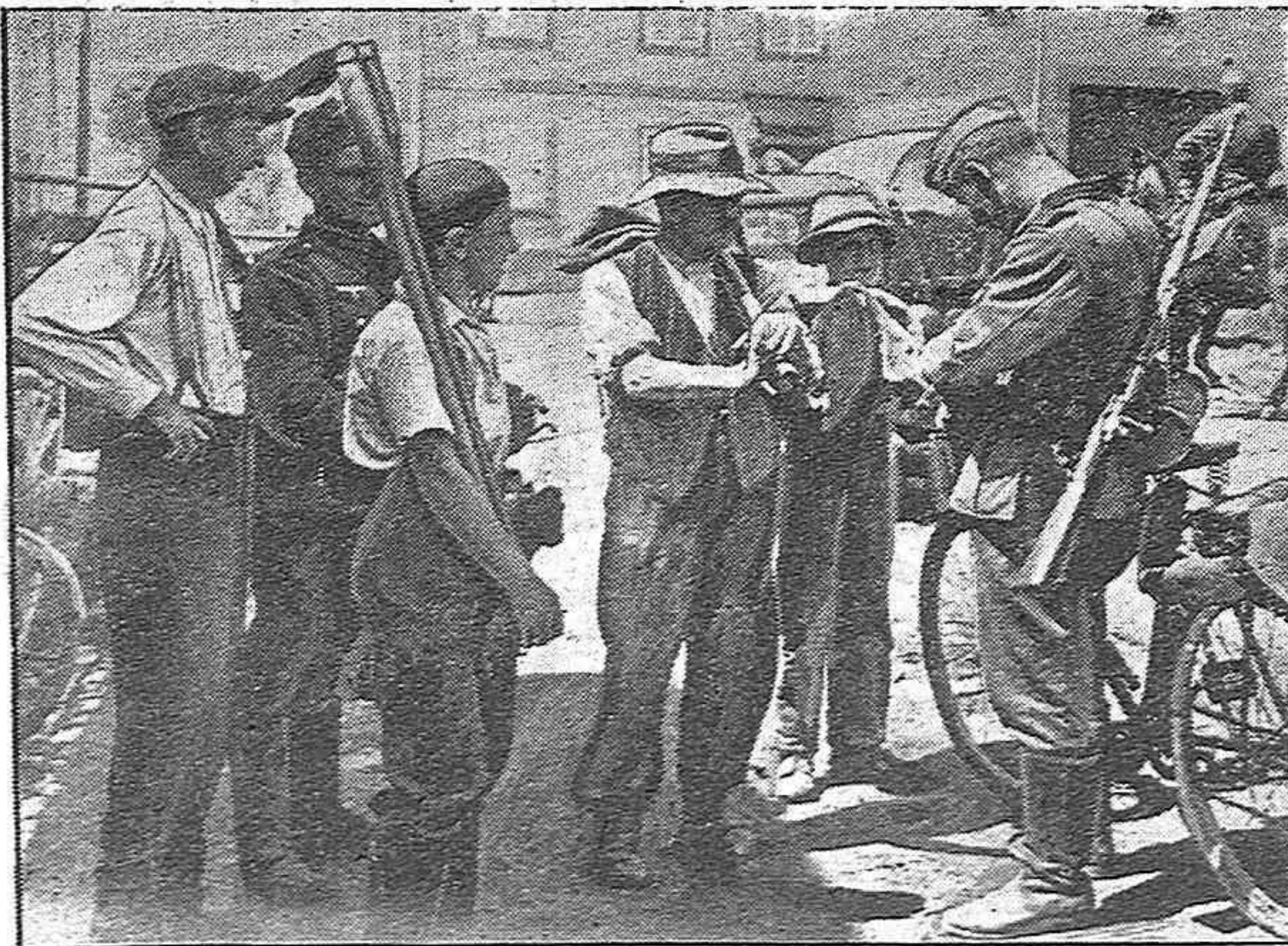
Alsacianos dejan su trabajo para charlar con los soldados alemanes

Soria 1 de Agosto de 1940.—El Admor. Principal.