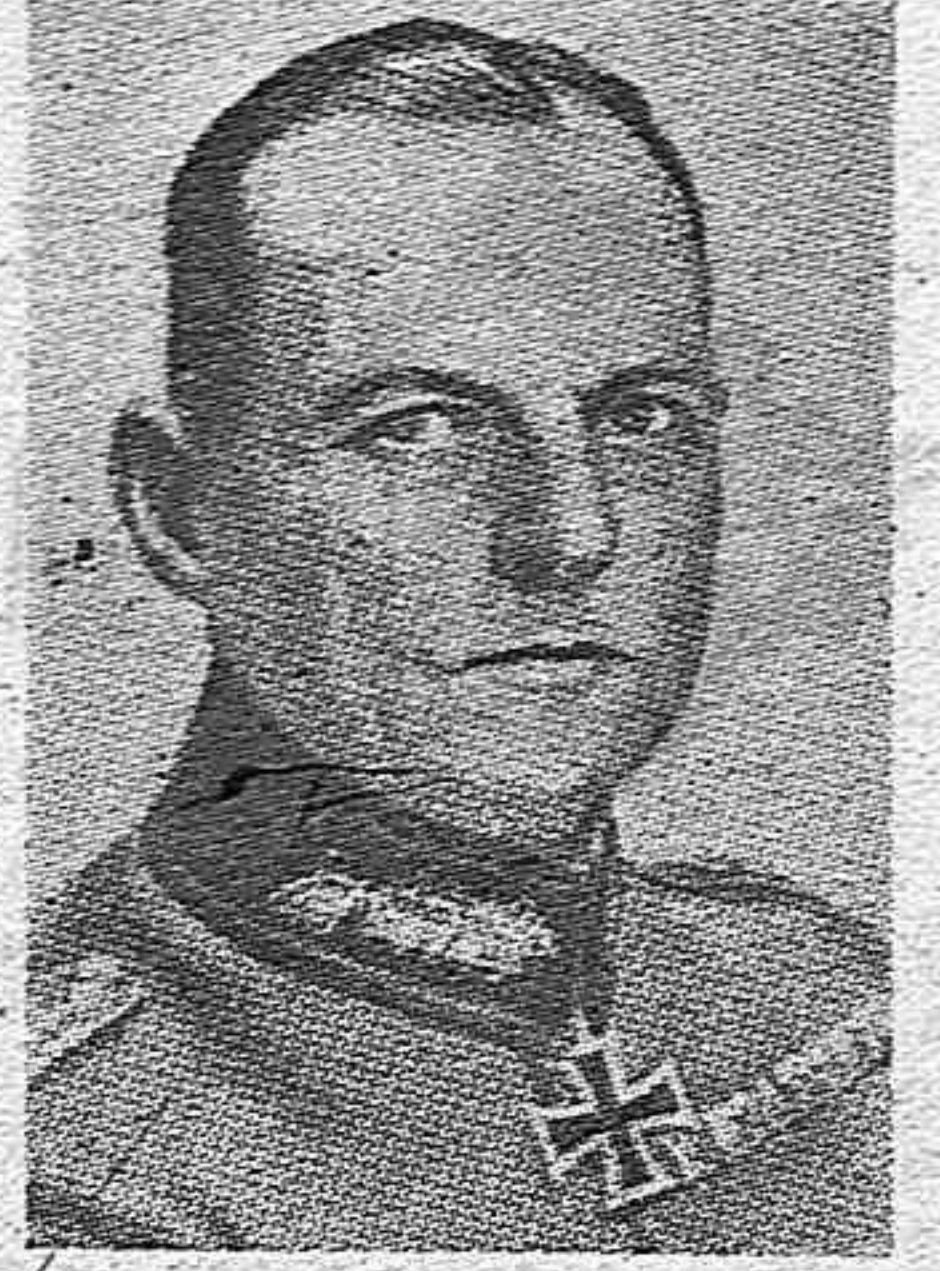
RUNDSTEDT ascendido por el Führer a Mariscal de Campo

HITLER recibe el MARQUES DE MAGAZ en audiencia de despedida