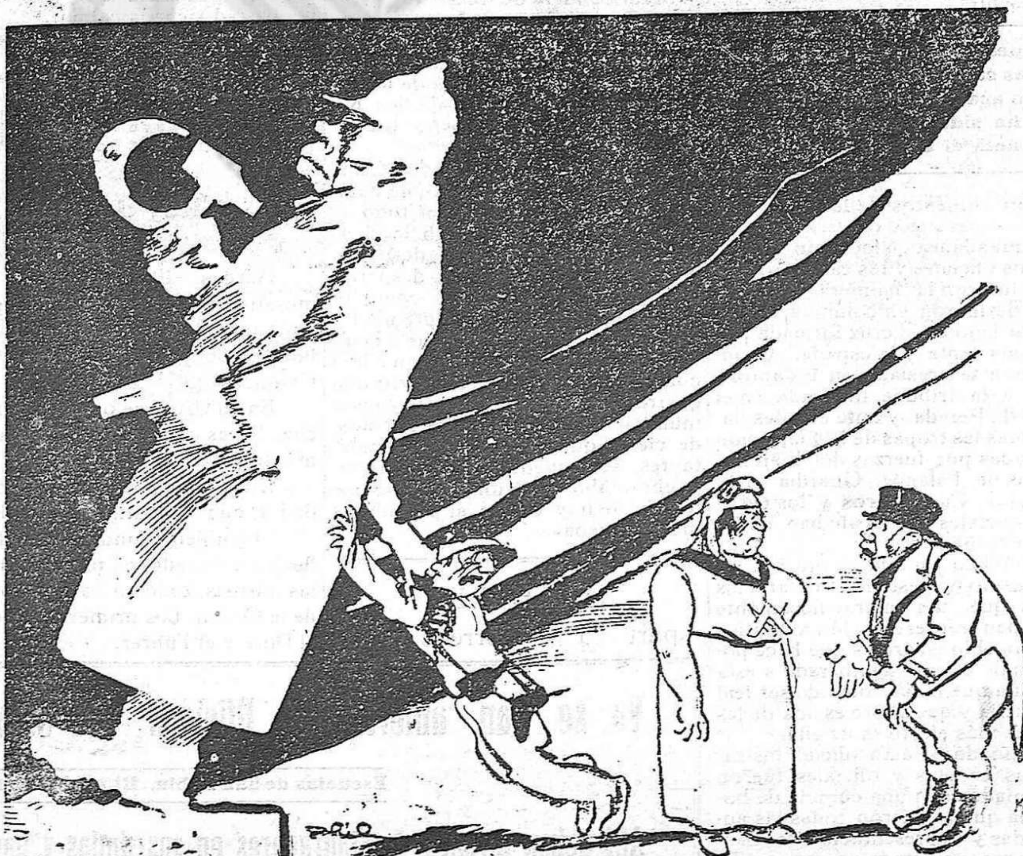
Cómo ven los rojos—y nosotros—la situación del marxismo español