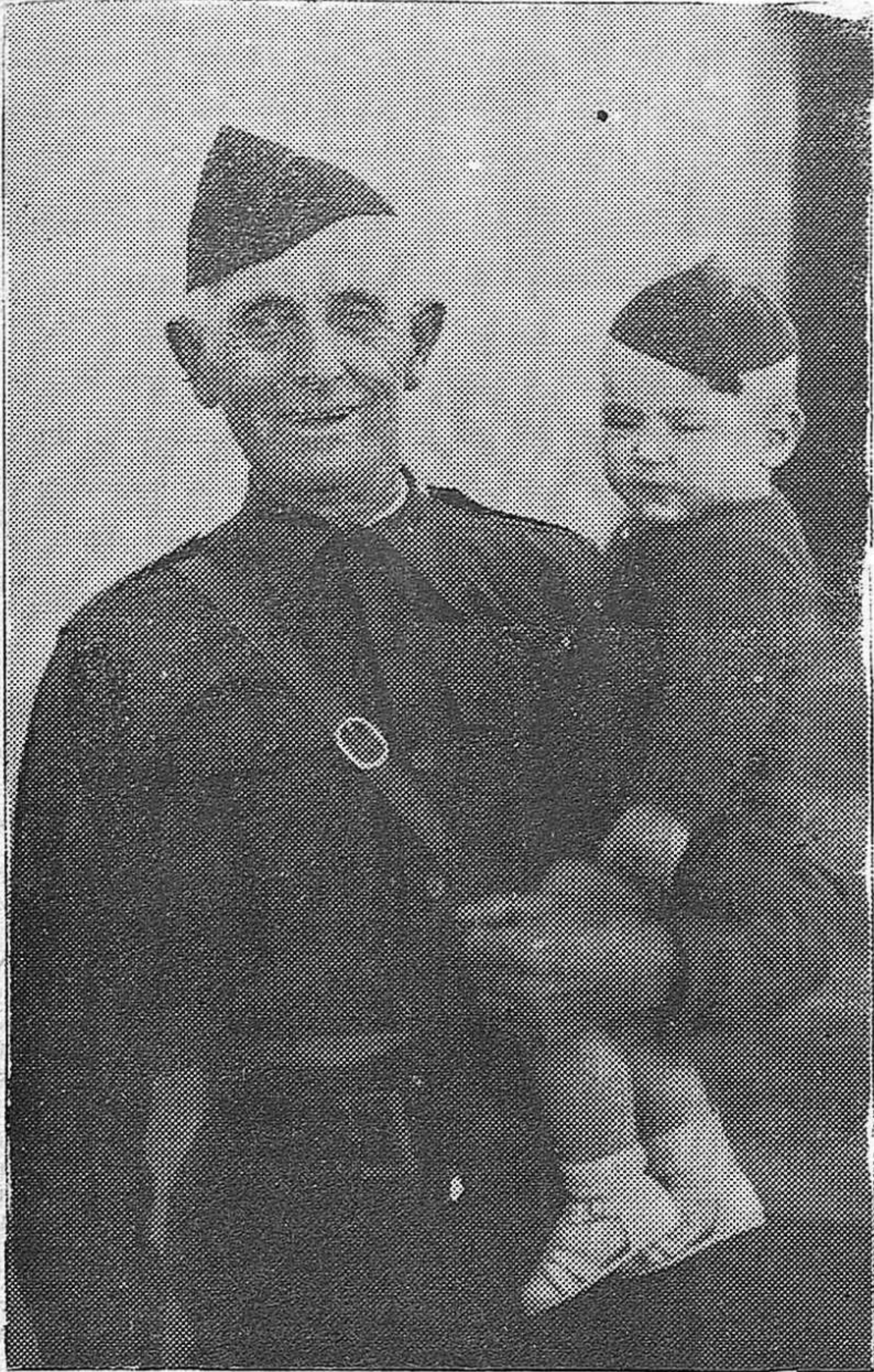
Abuelo y nieto muestran su fé en los destinos de la España nueva como un símbolo de la España de hoy que sonríe al futuro en la unidad de esperanzas y creencias