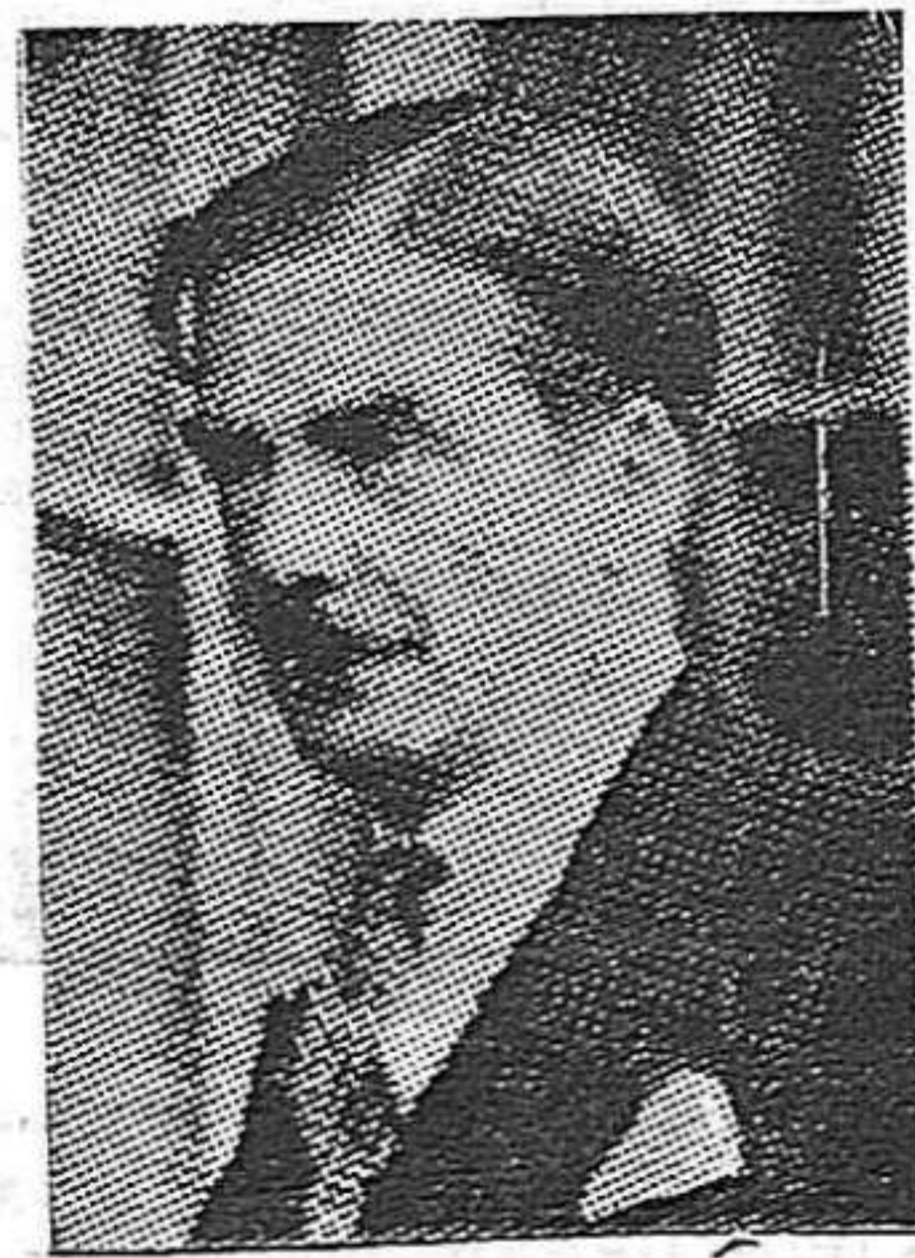
El ministro de Negocios Extranjeros de Inglaterra señor Eden