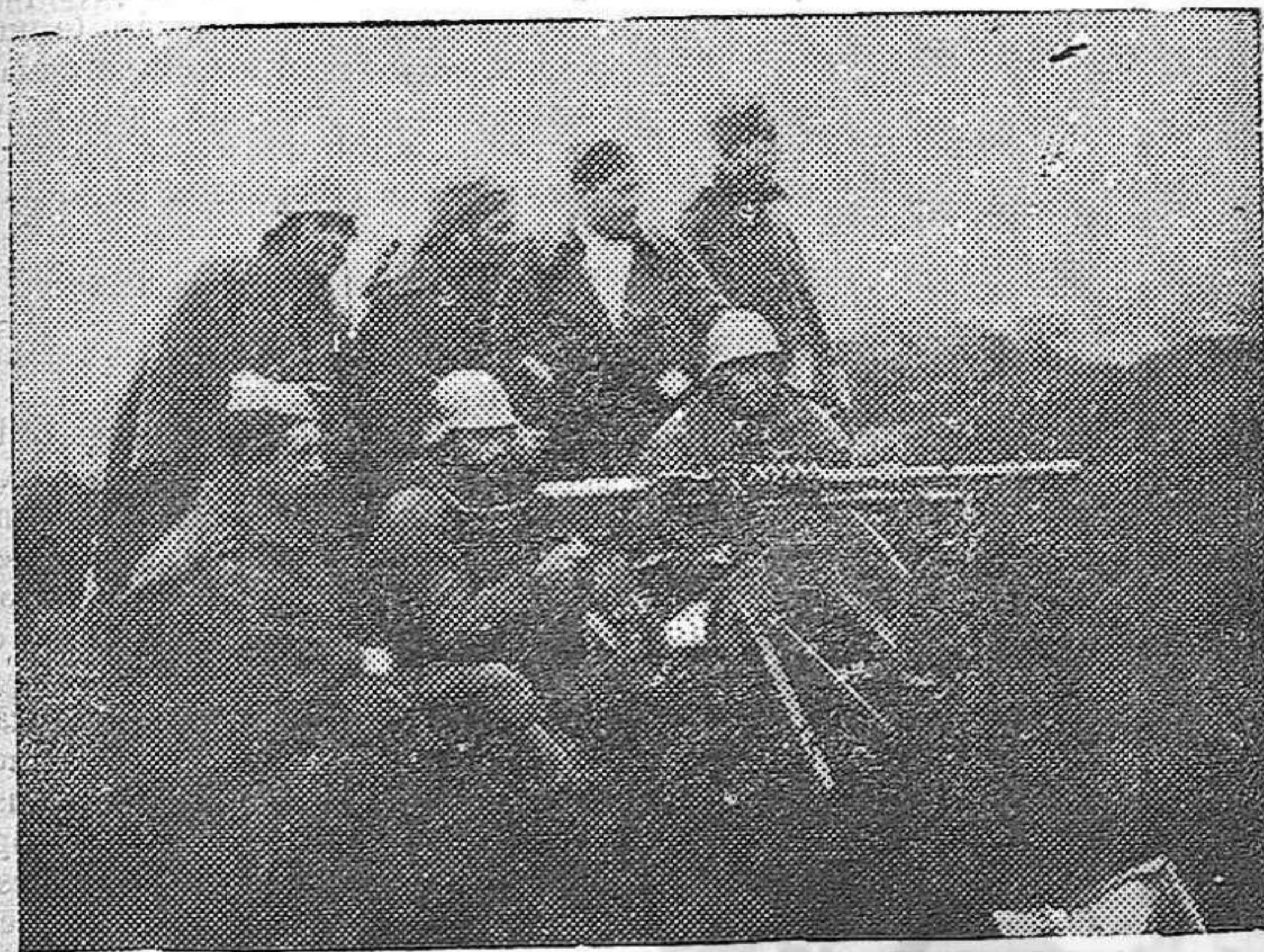
«Al pie de Somosierra, por los trigales la primera guerrilla y la primera impresión de sangre»