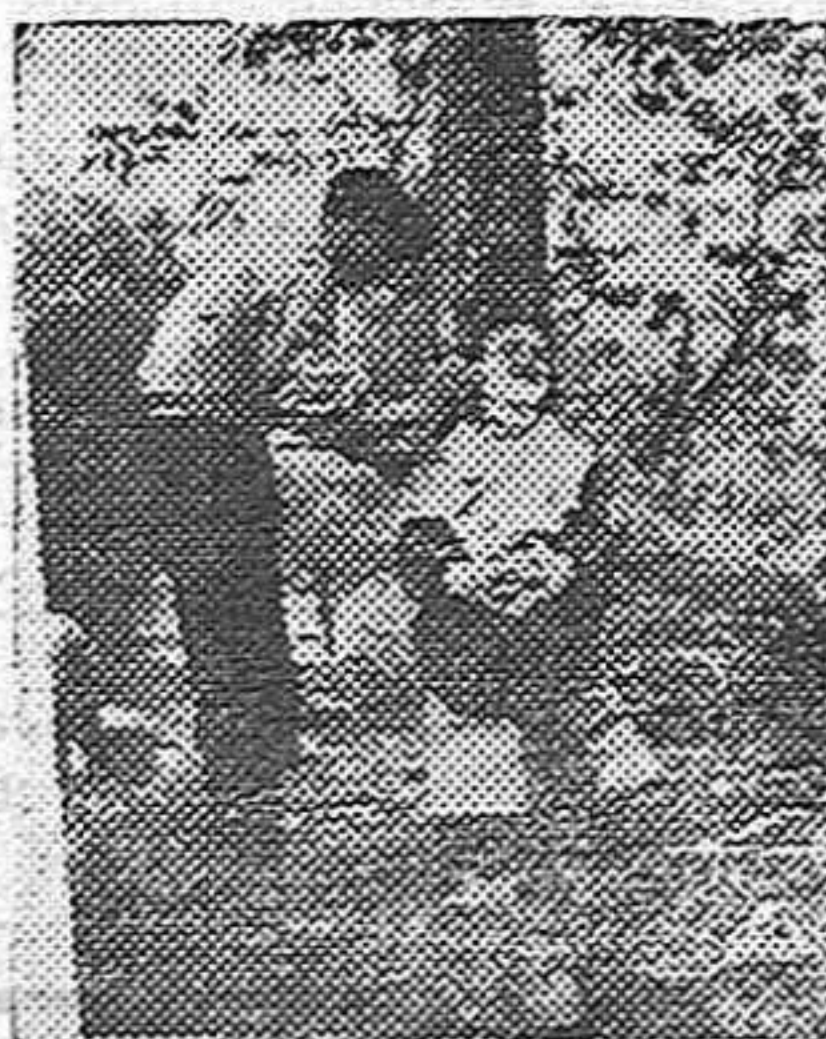
Aprovechando un descanso un requeté acita a un falangista