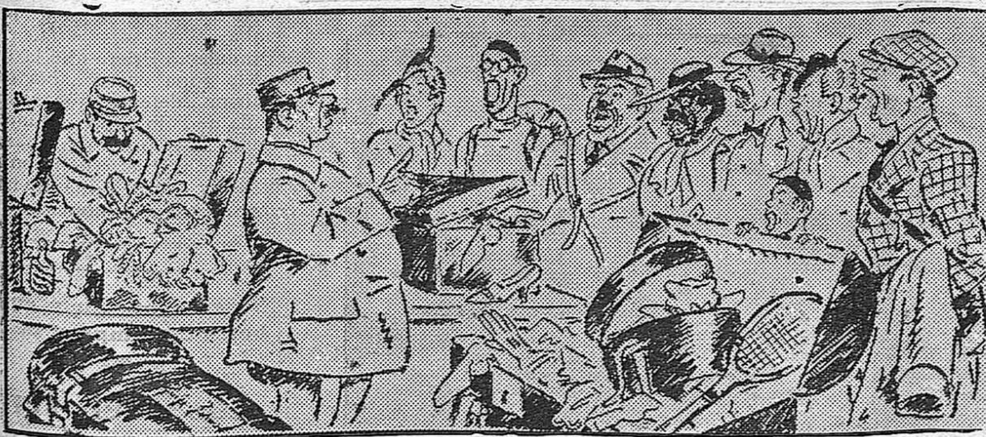
El «Control» en la frontera francesa

Roma.—El «Laboro Fascista» escribe acerca del acuerdo sobre el intercambio de obreros entre Alemania e Italia y sobre la colaboración social del eje Roma-Berlín, que este eje es una gran base para acuerdos constructivos. El acuerdo para el intercambio de obreros permitirá a las dos partes conocerse mejor.