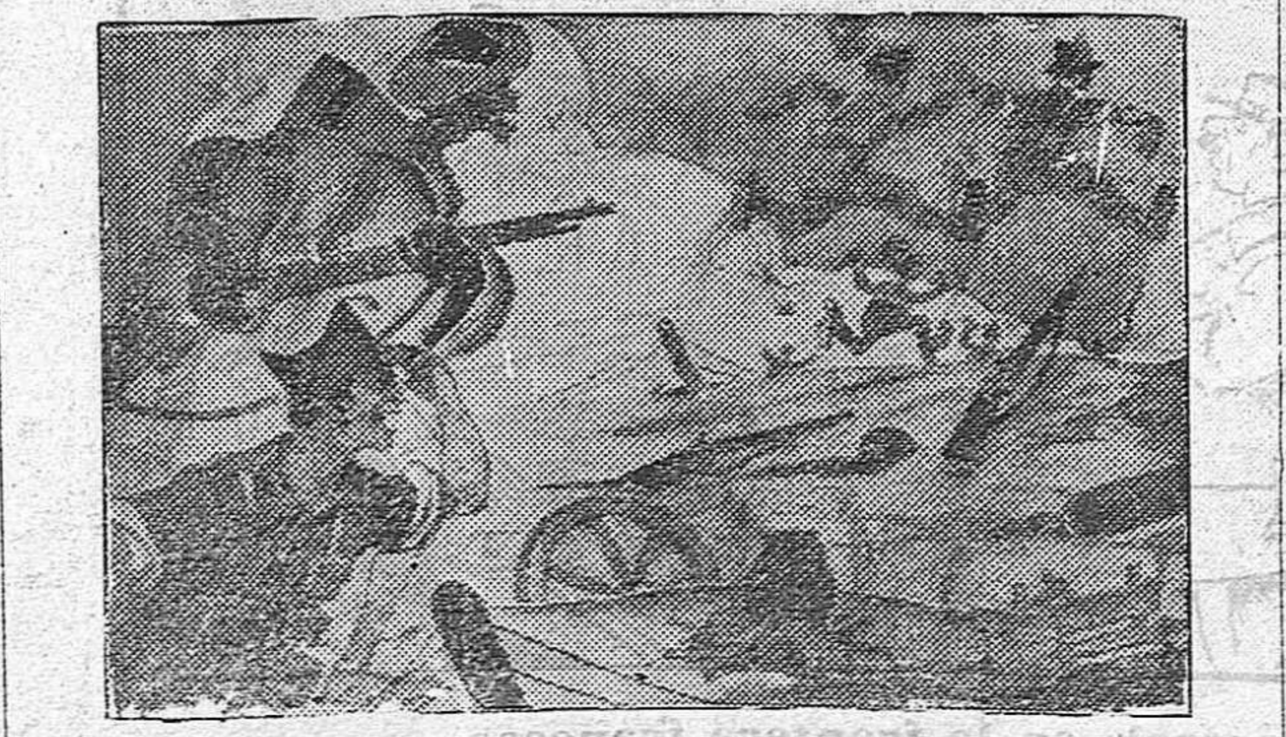
Un contraataque de los rojos

Es mucho el entusiasmo que existe por esta patriótica novillada, lo primero porque todos sabemos que el beneficio de la misma pasa íntegro al «Subsidio pro-Combatientes» y lo segundo que a los aficionados les ha sentado muy bien el cartel de toros y toreros, pues son muchas las localidades ya pedidas. Los toros han llegado ya y serán desencajados hoy a las siete de la tarde. Para asistir a dicha novillada habrá servicios especiales de coches de línea. También el lunes, en honor de los heridos de guerra, niños y niñas de las escuelas públicas y niños del Hospicio, se celebrará en la Plaza de Toros una función de Circo por una inmejorable Compañía. patriotismo de los sorianos, acrecentando el odio que sienten hacia aquellos que, careciendo del valor y de la hombría necesaria para defender sus posiciones, no vacilan en atacar pueblos y ciudades de retaguardia cometiendo crímenes muy en consonancia con su manera de ser y de pensar.