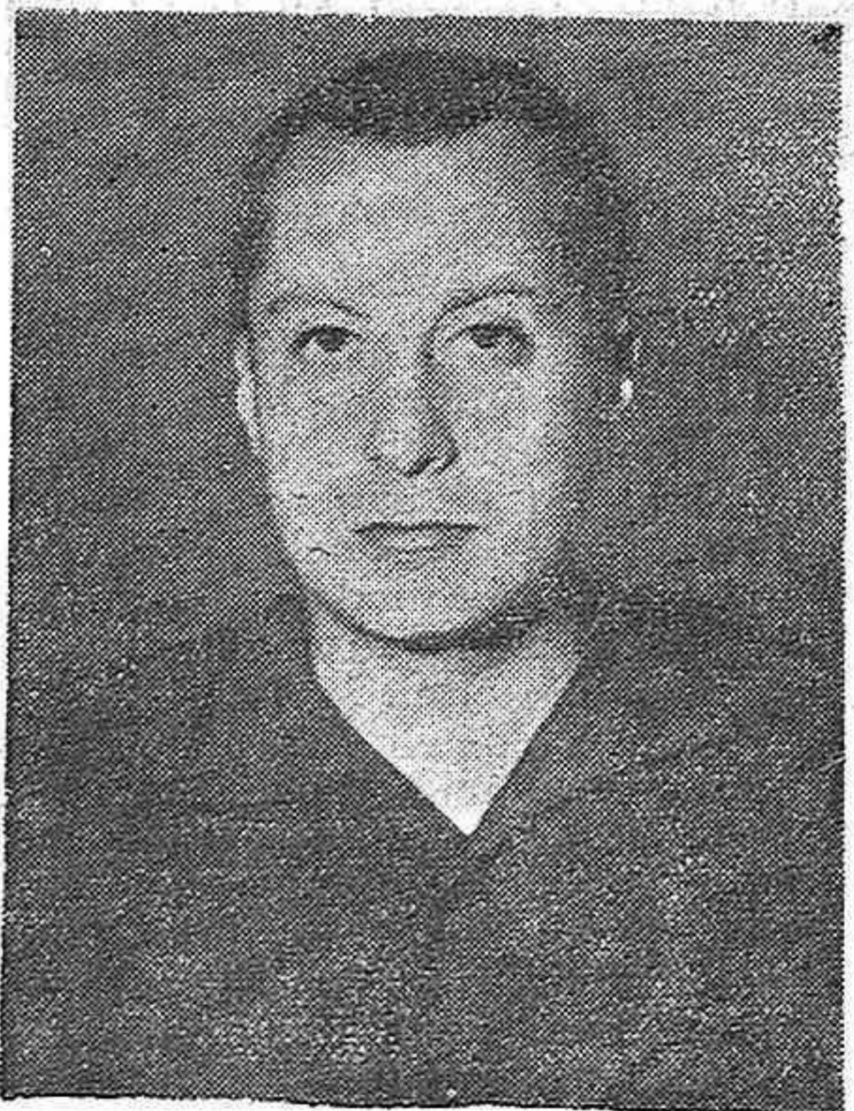
Nuestro Caudillo ha confirmado la dolorosa noticia de la muerte de nuestro Ausente. En nuestra voluntad de servicio siempre estará presente aquel que nos dió la luz primera del renacer juvenil y heroico de la Patria. De este modo, viviendo en nosotros y en nuestra conducta, guardaremos la eterna ausencia de JOSE ANTONIO

Que así se hará, si vosotros sois siempre unos en la obediencia, en la fe y en el impulso. ¡Arriba España! ¡Viva España!