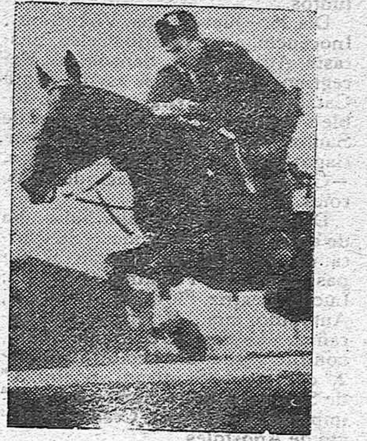
En la Italia fascista el deporte ocupa un lugar preeminente en todas las jerarquías. Muchas veces ha sido al propio Duce al que hemos visto practicando la o el esquí. Hoy, en esta fotografía aparece el Secretario del partido fascista, señor Starace en un magnífico salto de su caballo.

En la discusión intervinieron todos los ministros, aportando ideas y urgencias «que permitirán ver las dificultades del abastecimiento.» Así, pues, de comida, ni hablar. Ya solo se aspira a ver las dificultades que se oponen a traerla. Poca cosa para satisfacer a los estómagos vacíos.